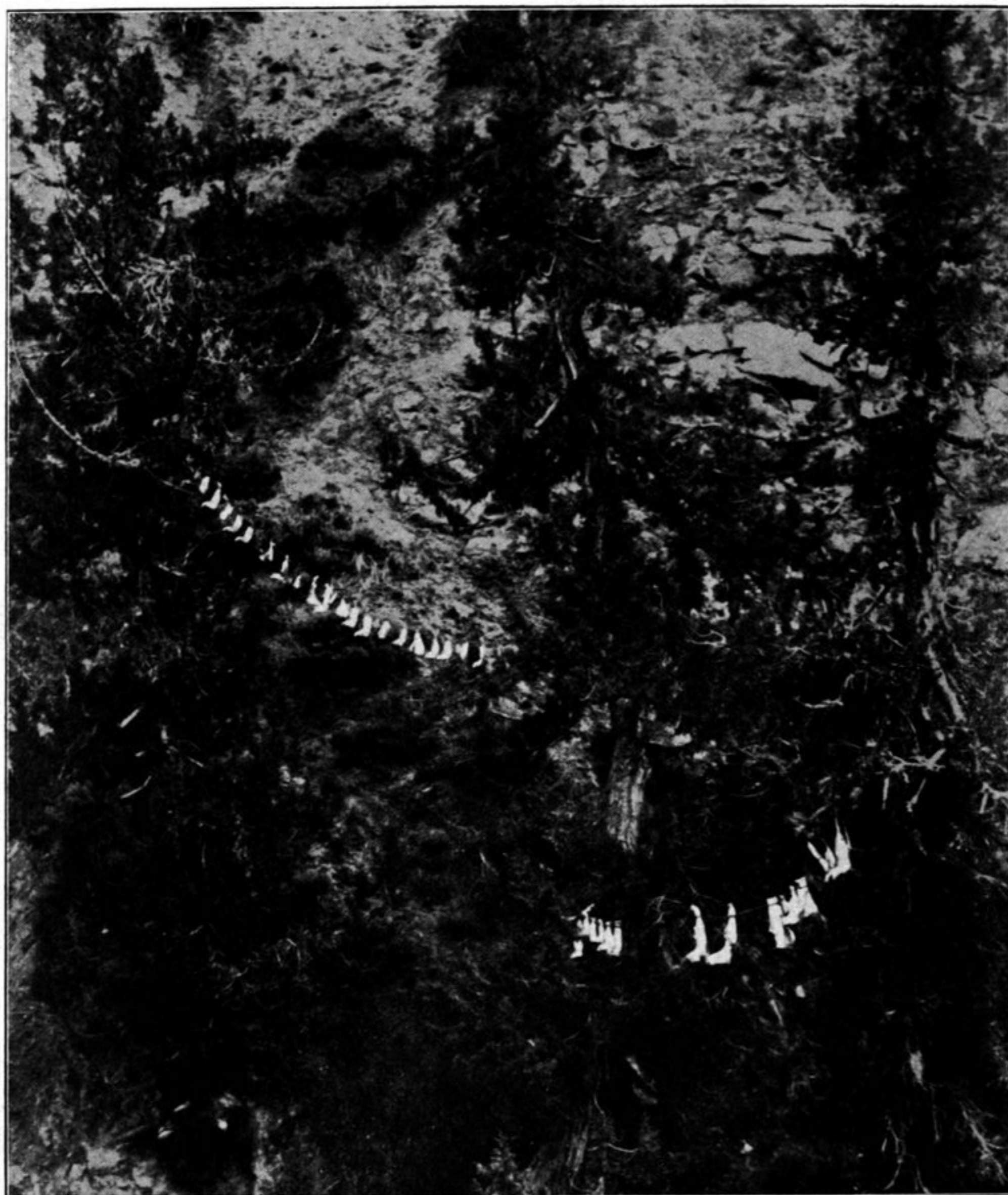
Begräbnisplatz in den Waldbergen von Schang in Ts'aidam. (Schafmandibeln, die mit Gebeten beschrieben sind.)