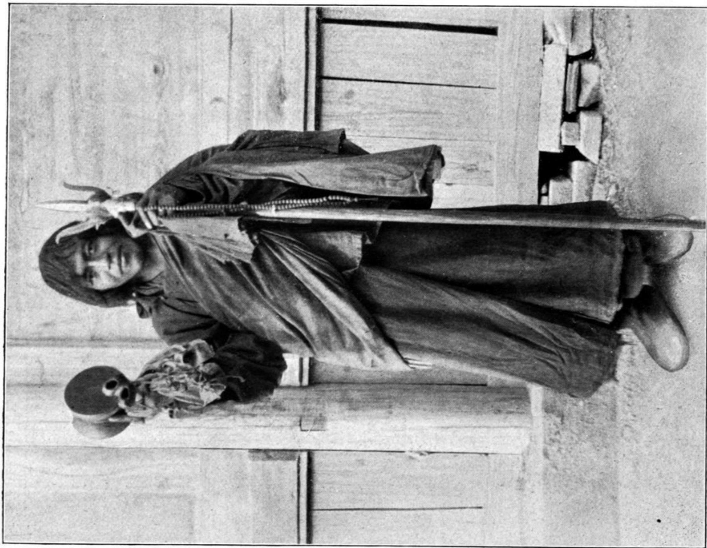
Bettelmönch aus K'am.