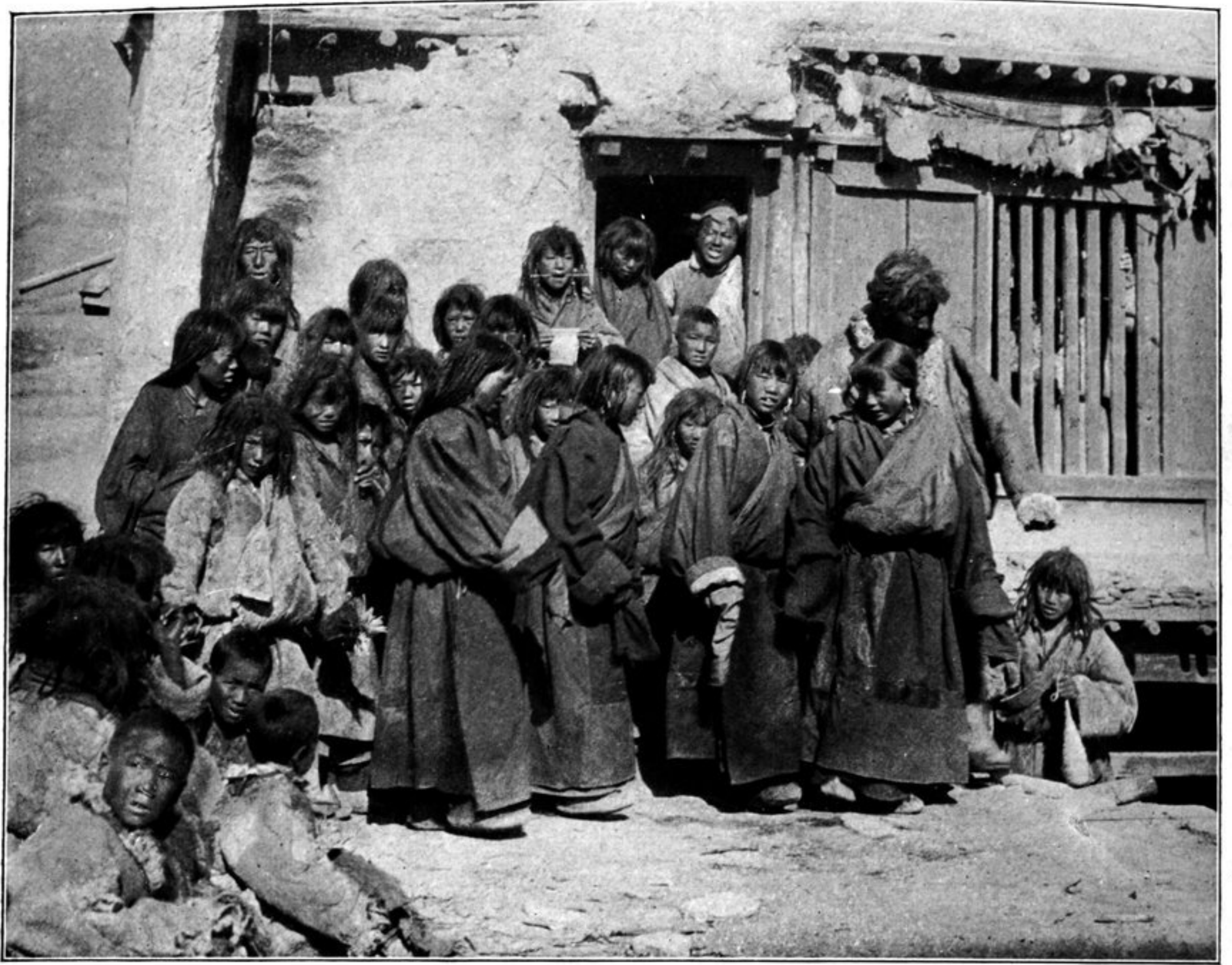
Tanz der Mädchen in Dscherkundo.