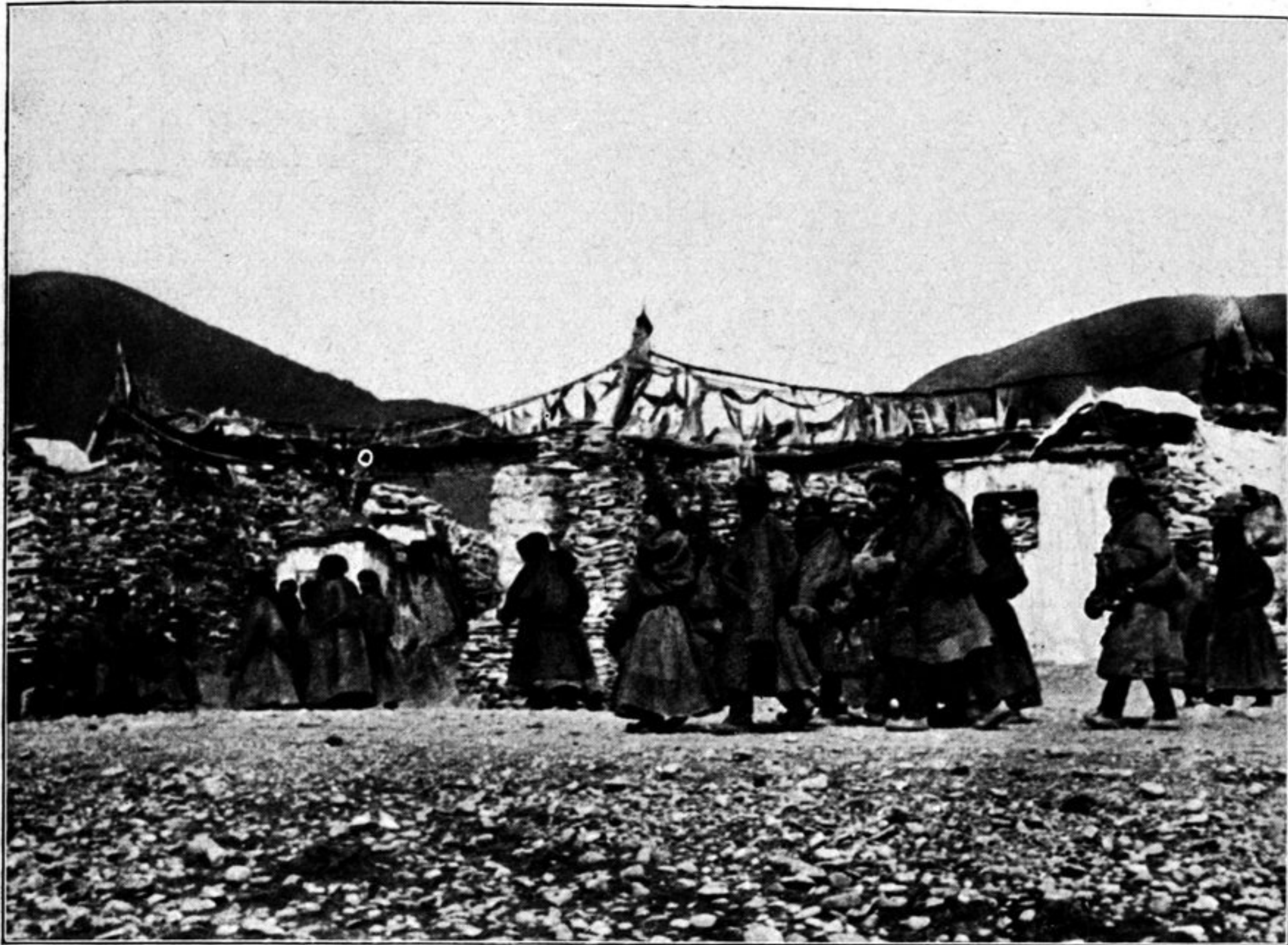
Mani tshwan: immer ging es rechts herum (s. S. 148).