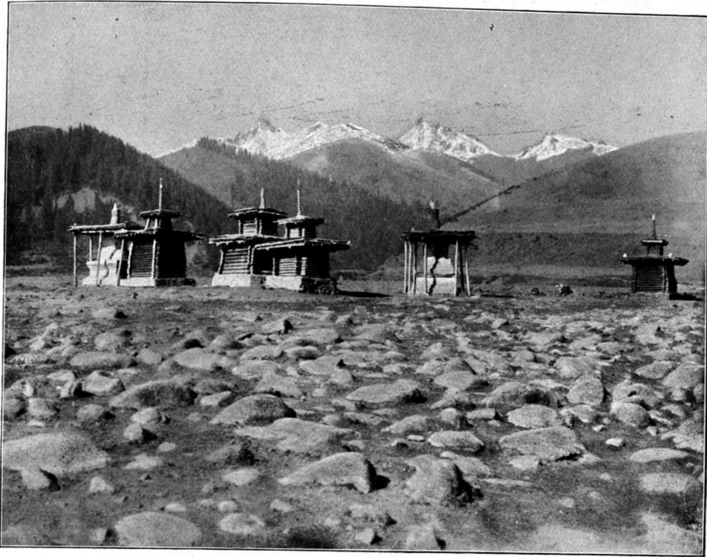
Tsch'orten im Lande Ling-gose.