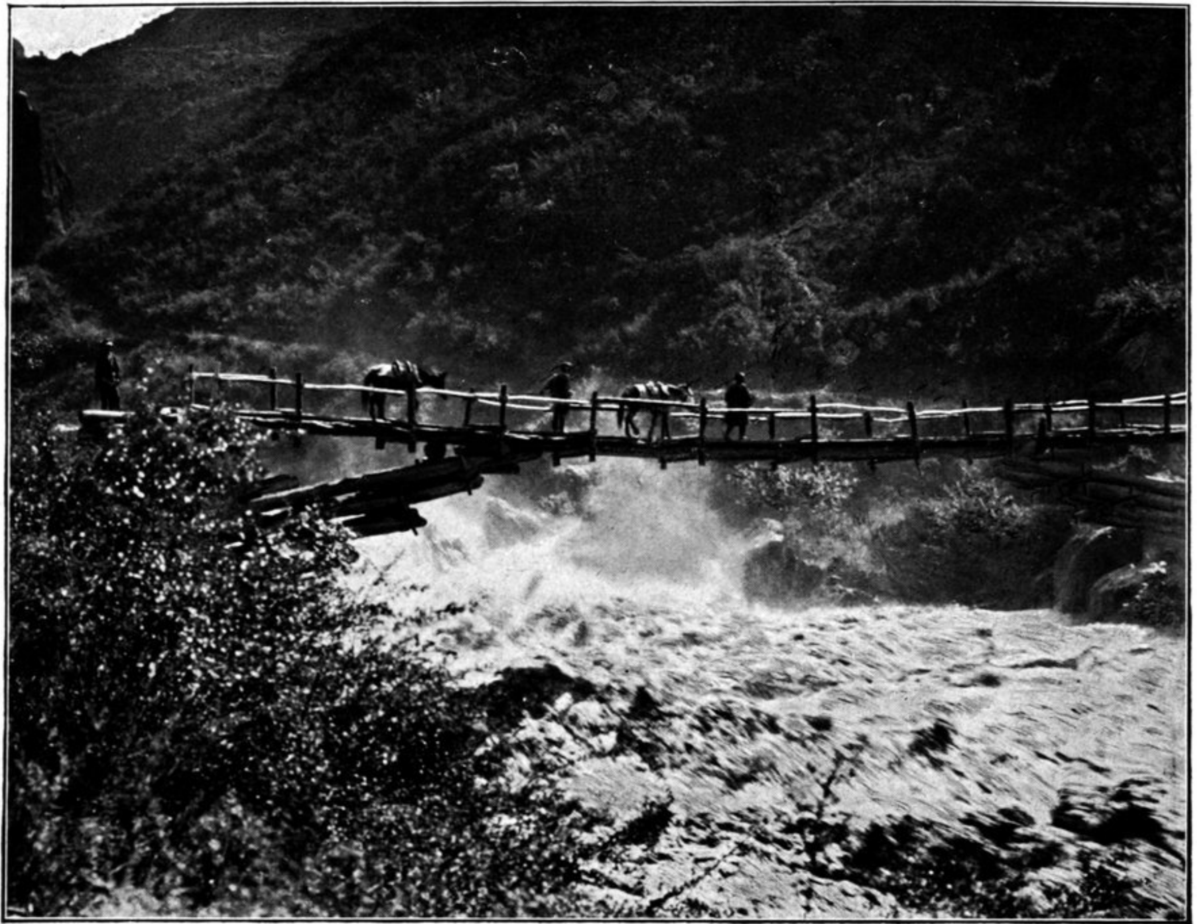
Kragbrücke über den Kleinen Goldfluß.