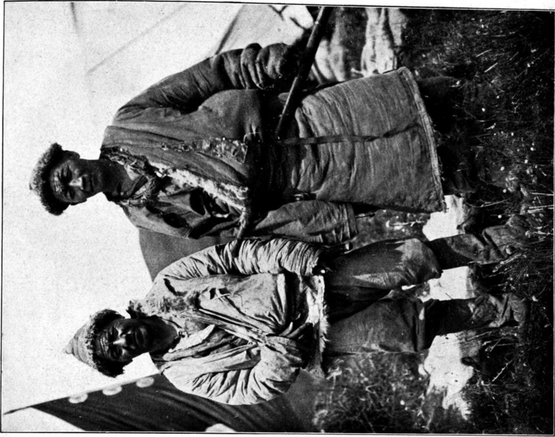
Tschemo tseho. Zwei Scharba-Tibeter der Tschangla-Miliz.