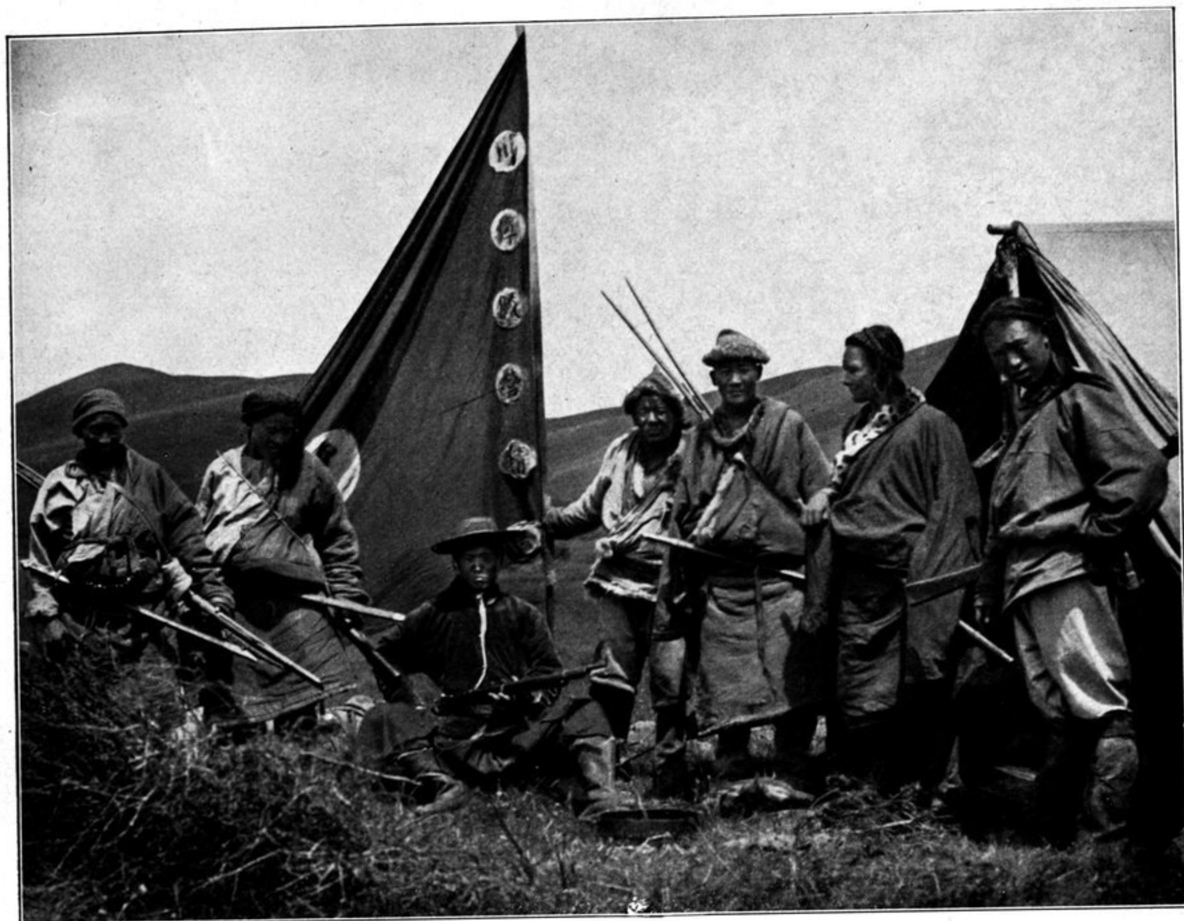
Der Tsungye von Tschang la und seine Standarte.