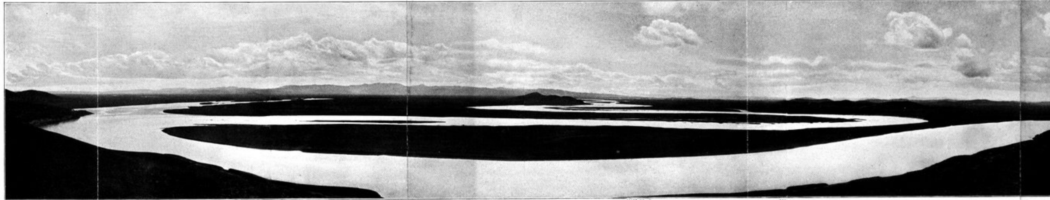
Süden, Einmündung des Gatschü, des Weißen Flusses.