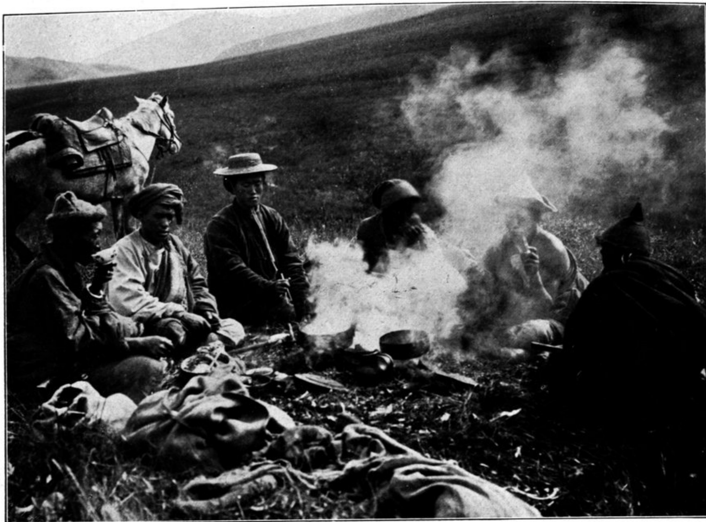
Meine Tischgesellschaft bei Rao gomba.

(Tschemo tscho, Brdyal, Wang Tsung ye, der Läwa-Führer, die 2 Tschangla-Führer.)