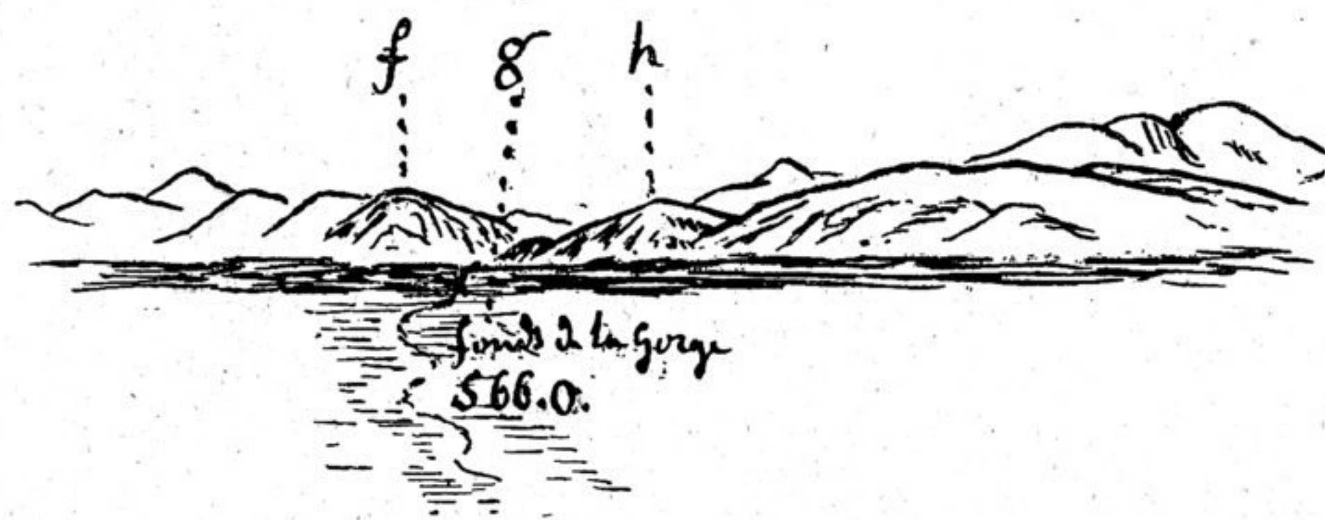
26 août 1892. — Vue de la gorge de l'ouest, prise du campement du 26 août 1892.