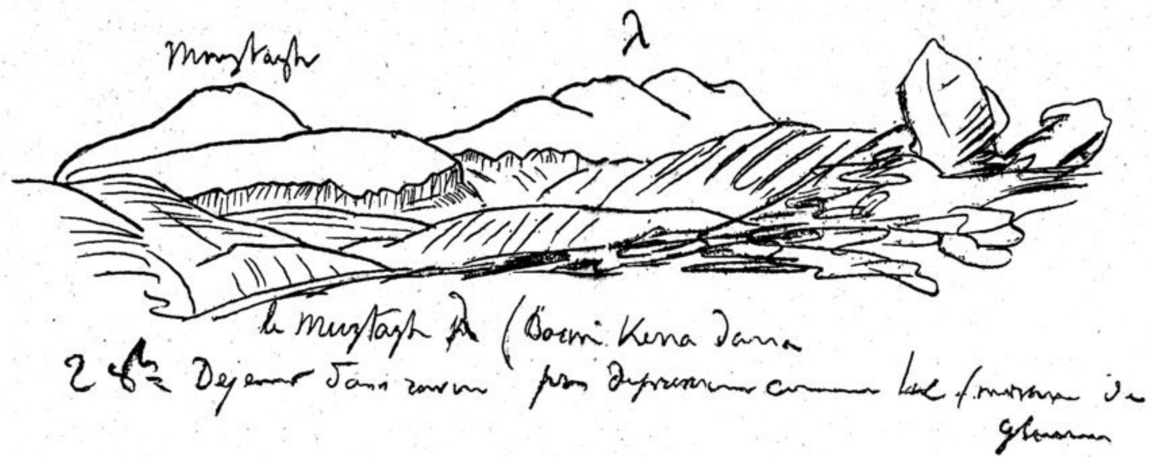
2 octobre 1891. — Vue du Tchoung Mouztagh (à gauche), prise du torrent qui en descend.