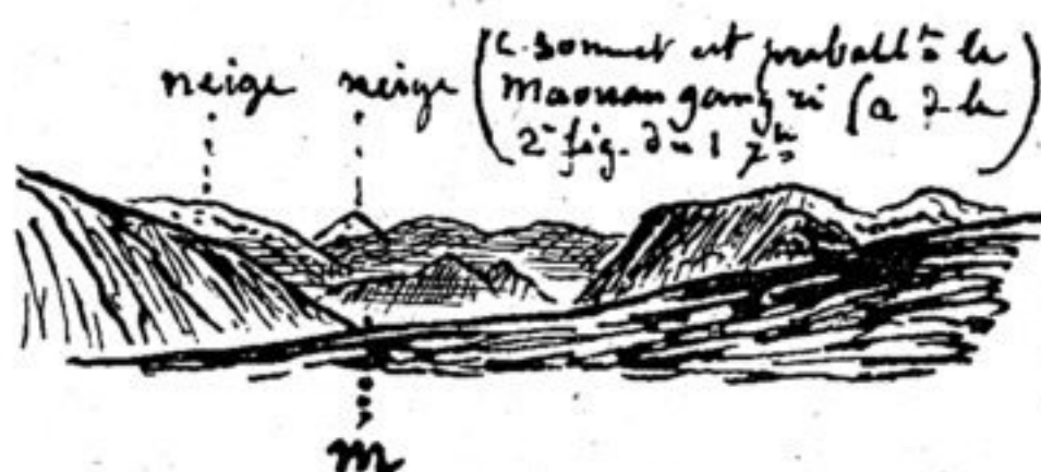
31 août 1892. — A 1 kilomètre du point ci-dessus, vue prise en avant dans la direction du Ma-ouang gang-ri.