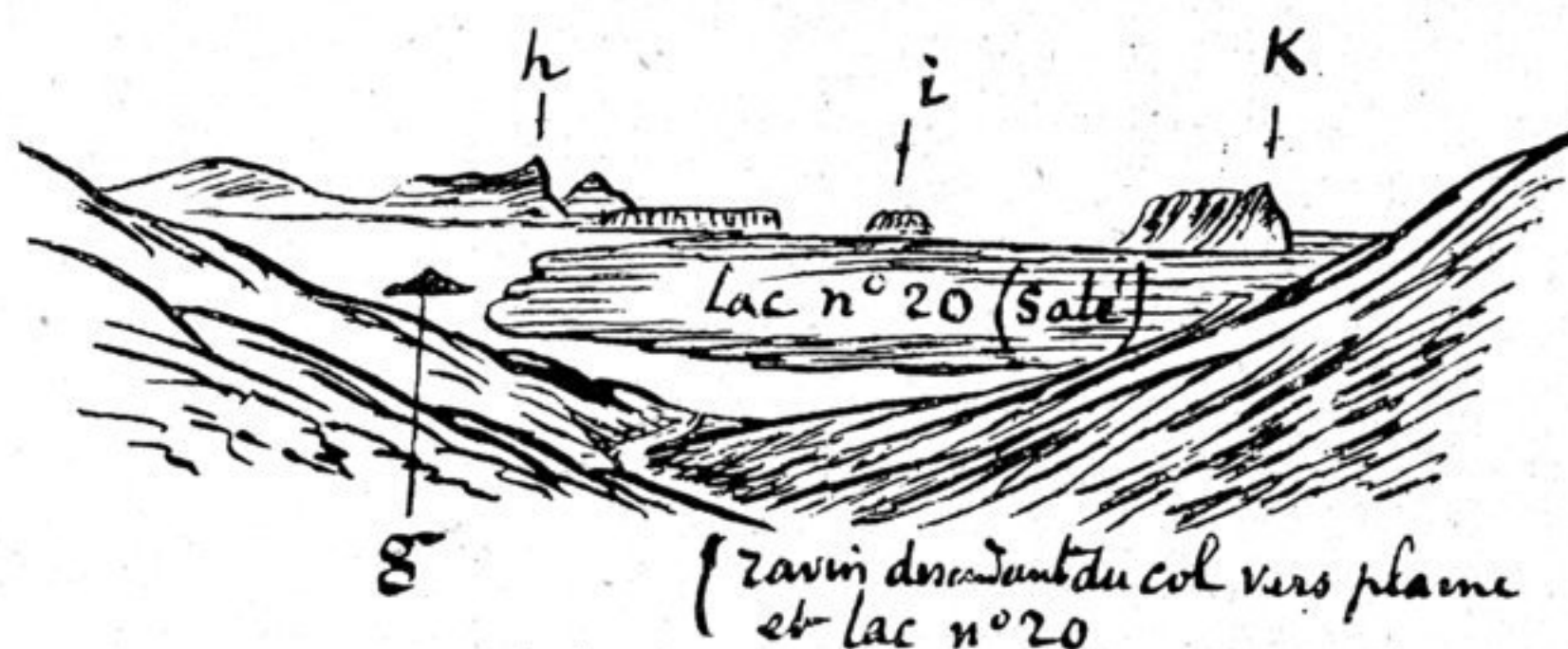
16 novembre 1893. — Vue prise du col qui domine l'extrémité occidentale du Gya-ring ts'o. Lac n° 20. — Gya-ring ts'o. g, h, i, k, collines au nord du lac.