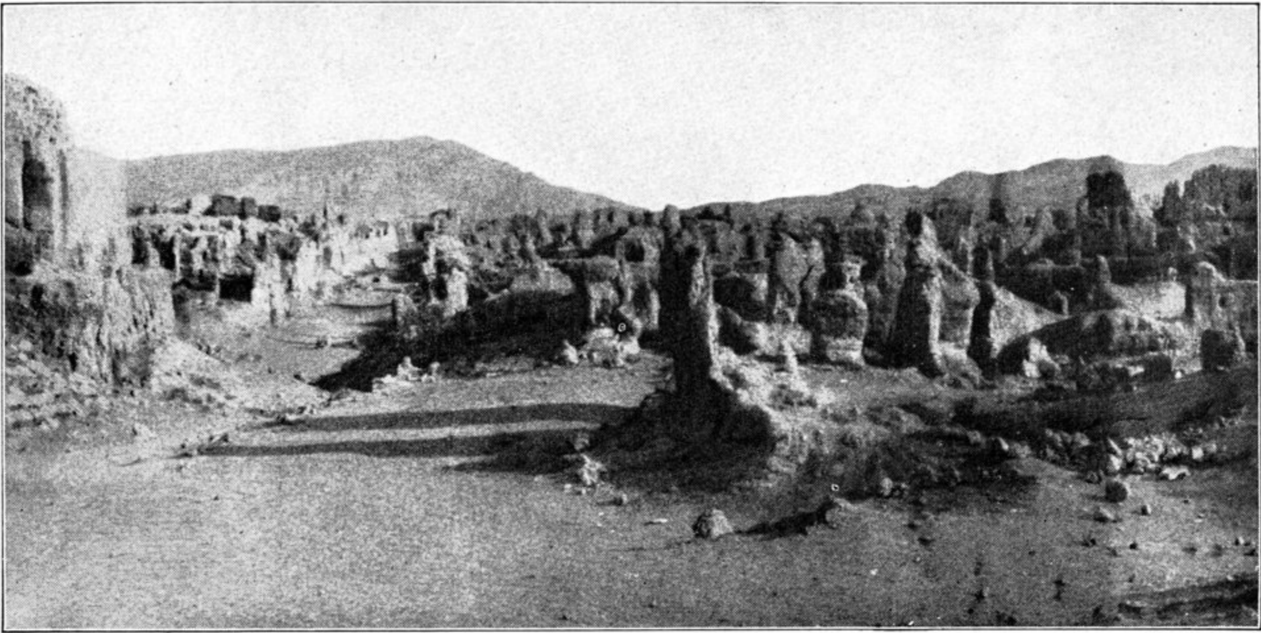
Straße in der Ruinenstadt Yar-choto bei Turfan