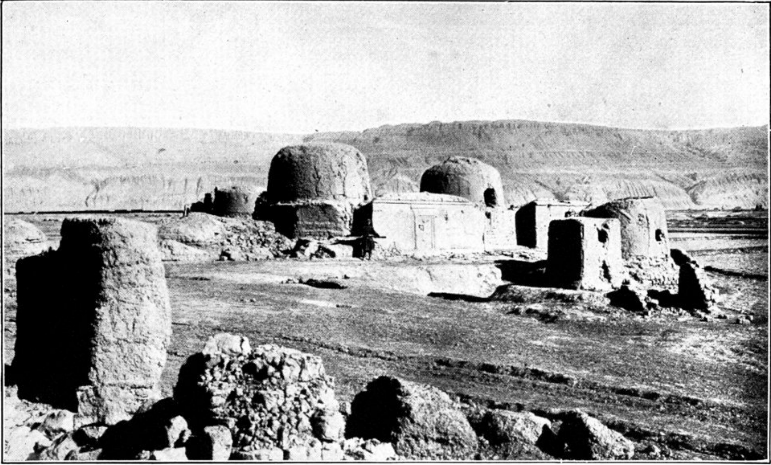
Grabdenkmäler, persische Kuppelbauten östlich der Ruinenstadt Chotscho