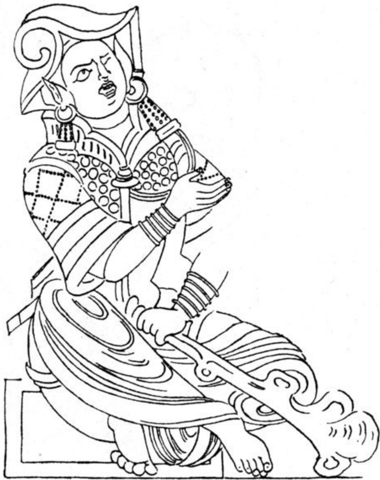
Abb. 27. Eigentümlicher Helm mit Volute, Kyzil. (Nach „Bilderatlas“),