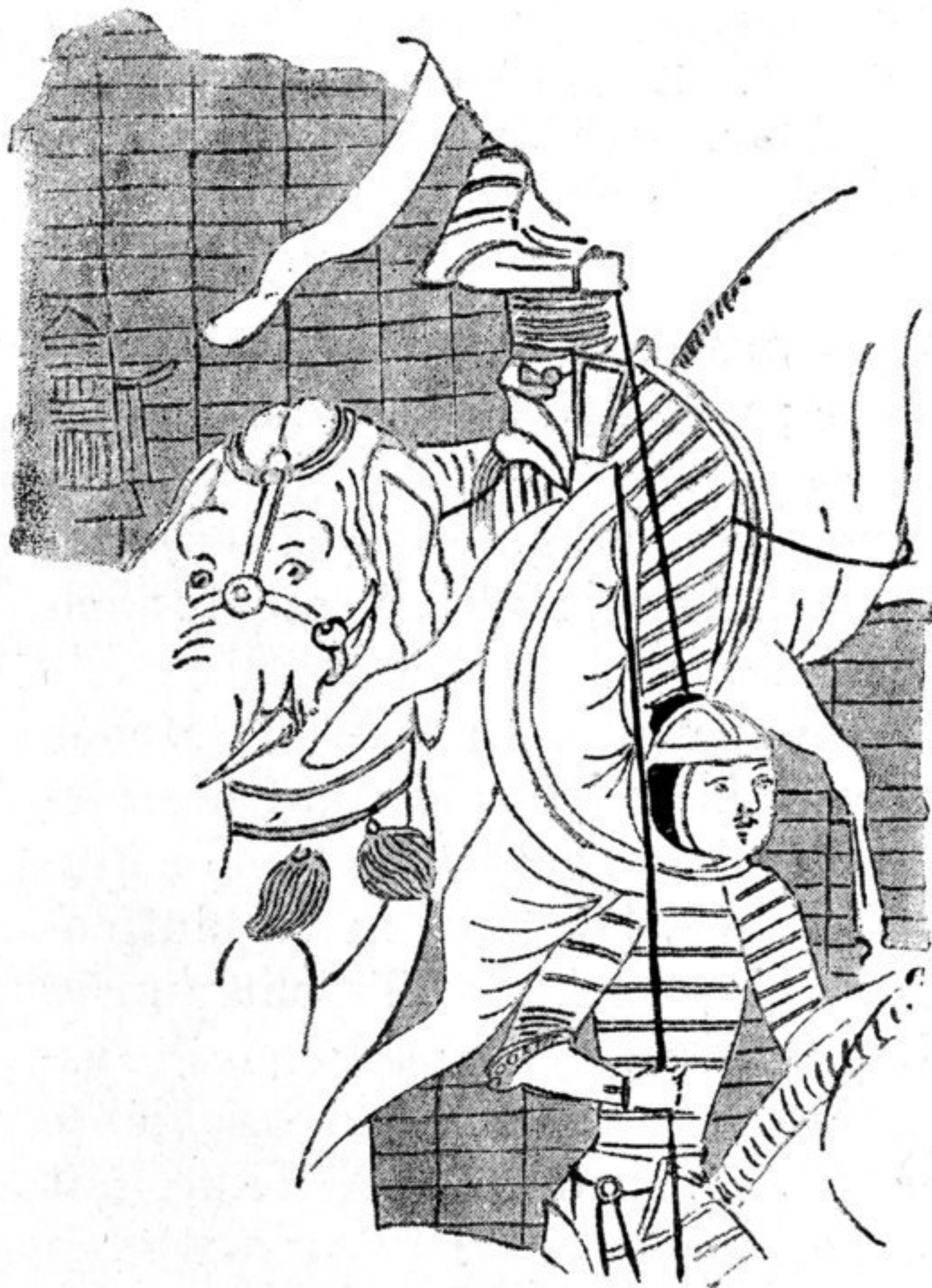
Abb. 29. Reiter mit Spangenhelm. Kreis-segmentwimpelfahne. Oase von Karaschahr. (Nach „Bilderatlas“)