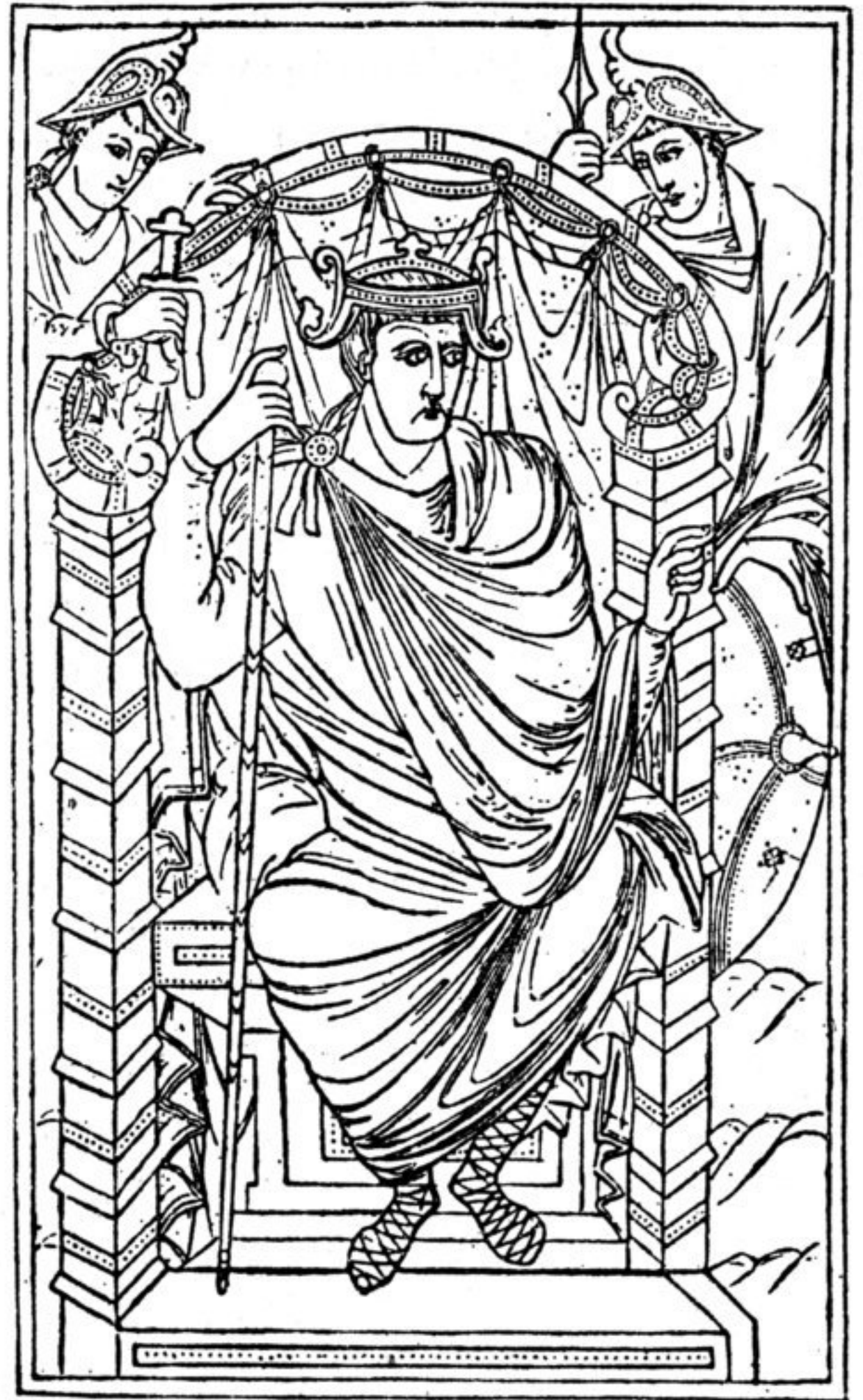
Abb. 28. Verwandter Helm aus einer Bibelhandschrift zu Paris (König Lothar). (Nach „Bilderatlas“)