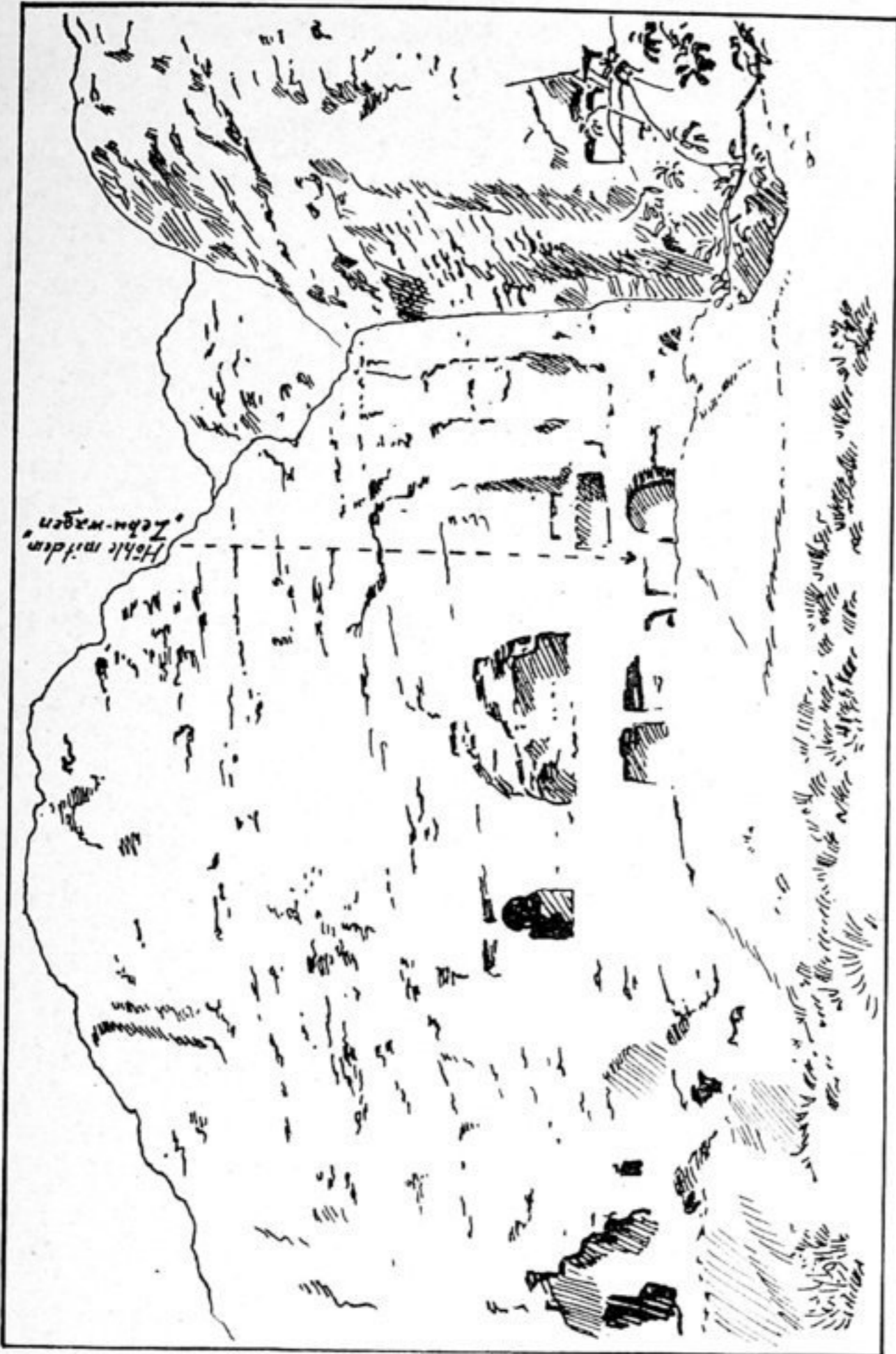
Fig. 83. Qyzyl, Höhlengruppe O von der 1. Schlucht. Gruppe hinter dem Bauernhause.