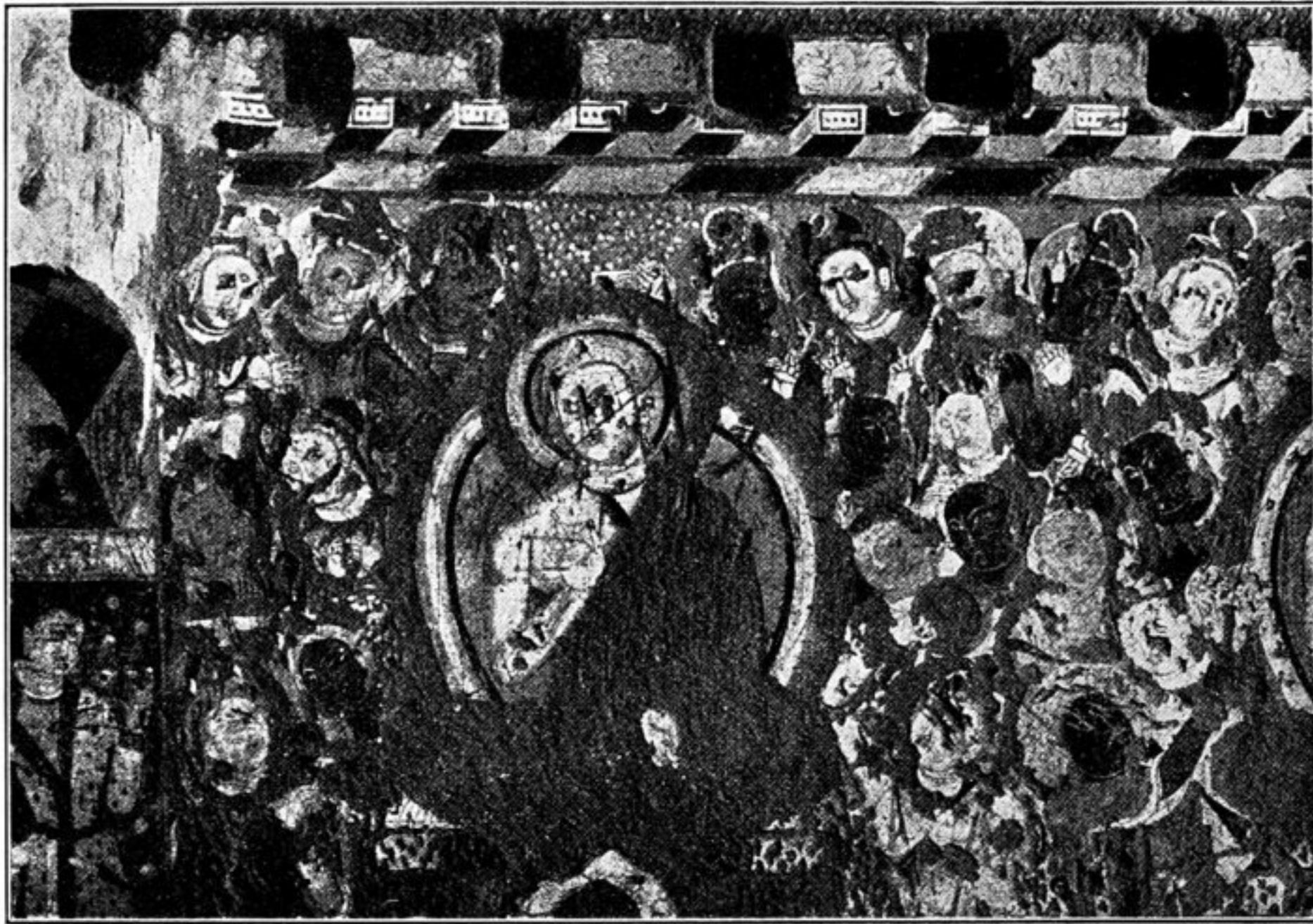
Fig. 103. Buddhapredigt bei III.

ein Fähnchen 2) haltend, 21 R. v. Buddha ein heranschreitender Asket, 22 L. v. Buddha ein Brâhmaṇa, über ihm Sonne und Mond, 23 R. v. Buddha ein Geharnischter mit Wimpellanze; Rüstung, Helm usw. sind identisch mit denen der Reiter im hinteren Gange 3) , 24 L. v. Buddha ein nackter Knabe von weißer Farbe, in der erhobenen R. eine Blume(?) haltend 4) , 25 R. v. Buddha ein stehender, betender König, 26 L. v. Buddha ein nur mit Lendentuch bekleideter, weißer Asket(?), 27 ein nur mit Lendentuch bekleideter, nackter Mann mit einem Henkelkrüge auf der Schulter vor Buddha wegschreitend 5) , 28 L. ein vor Buddha kniender König, der in der L. eine Blumenschale hält, mit der R. nach Buddha ein Bukett wirft, 29 fast identisch mit 13 6) , 30, Nebenfigur unklar, 31 R. v. Buddha ein Mann mit fünf Lampen, je eine in den Händen, auf den Schultern,