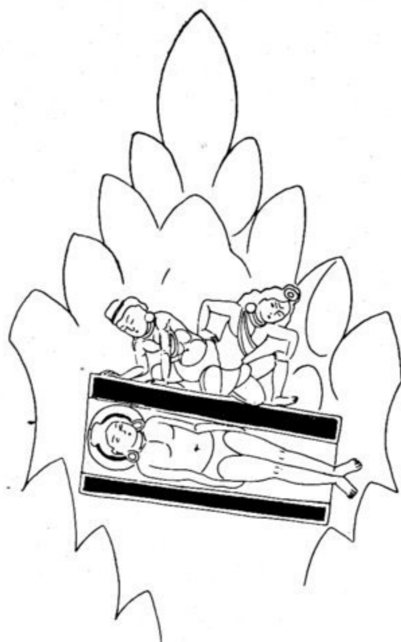
Fig. 159. L. 43.