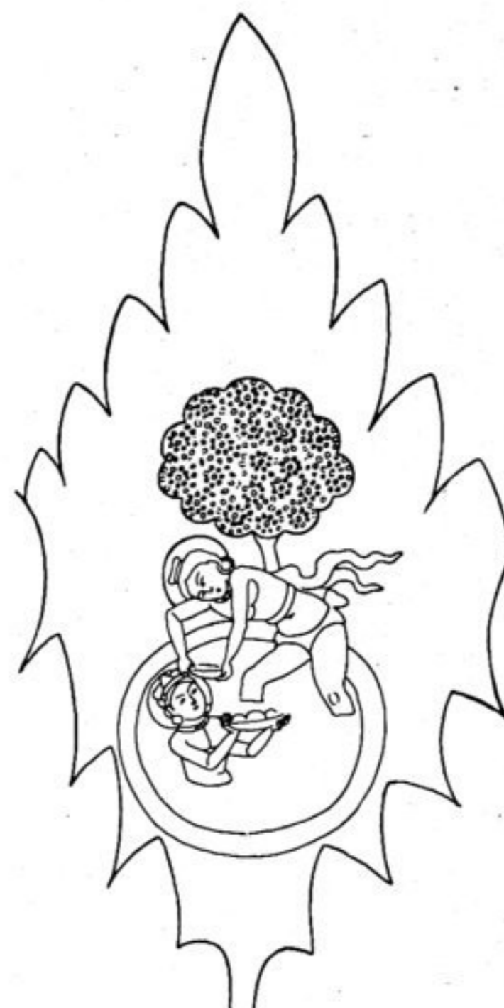
Fig. 160. L. 44.

— 26—33 Bodhisattvareihe . 26 Im Hintergr. steht ein Thron. Bodhisattva stürzt sich mit gefalteten Händen nach unten, wo fünf Schlangen zusammengeringt sitzen. Fig. 152. Variante: Gebetmühlh. b , 17? Vielleicht: Bodhisattva stürzt sich in den Abgrund ( prapâte patitah ) bei S. v. Oldenburg, Zapiski 7, 238, Mahāvastu I, 95. — 27 Ein Baum, darunter schindet ein Mann ein Tier, ein zweites steht im Hintergrund. Fig. 153. Variante: Bodhis. Gew. H. R. 12 (dort ist das Tier ein Elefant! — 28 Ein reitender Mann tötet mit einem langen Schwerte einen vor ihm knienden Hirsch.