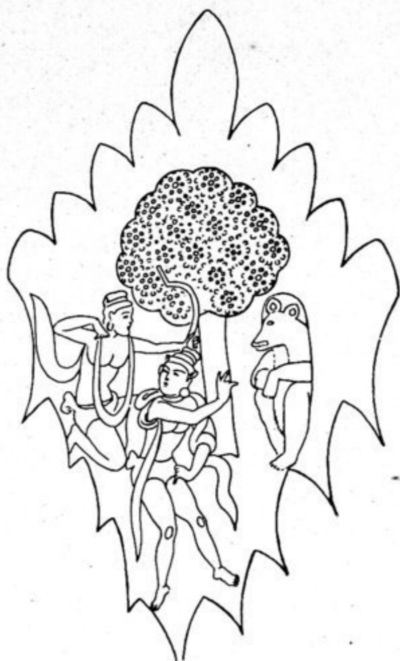
Fig. 156. L. 31.