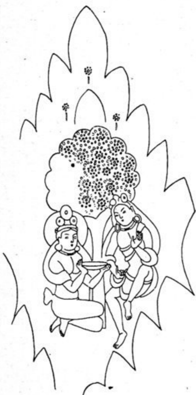
Fig. 158. L. 42.