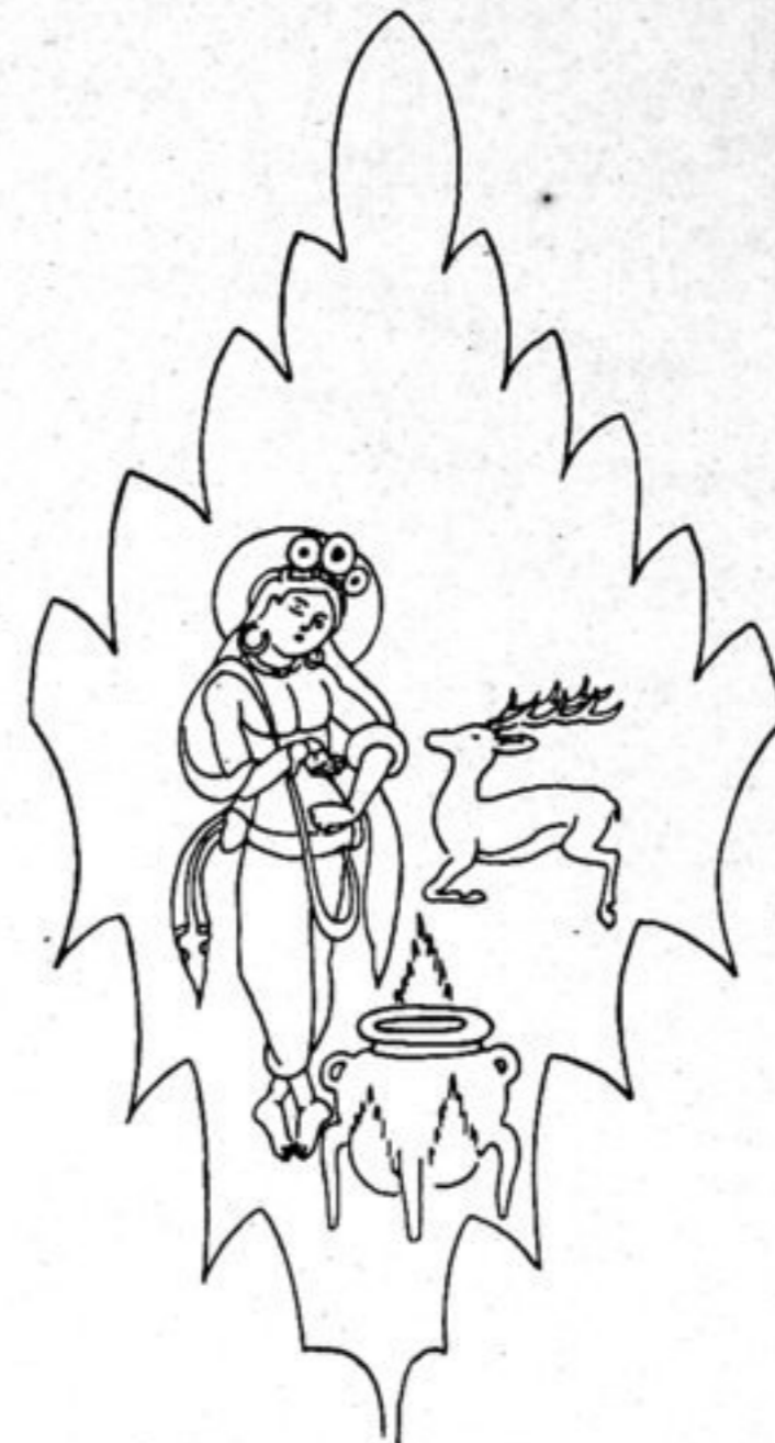
Fig. 157. L. 32.