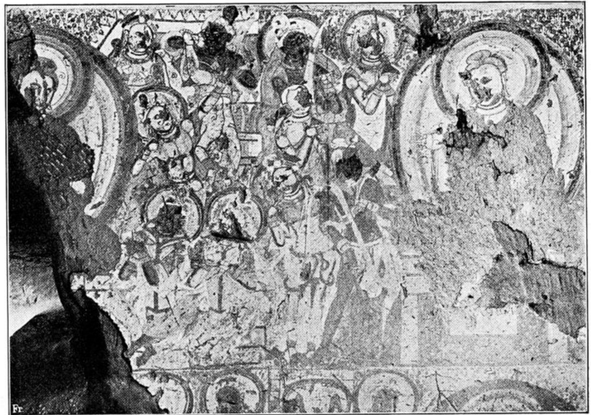
Fig. 218. Buddhapredigten aus Seitenw. b. Bild 1, 2, je die Hälfte.

Fünfte Reihe: 29, 33 verloren. 27 Buddha, wie eb., L. ein sitzender betender Mönch (añjali), vor Buddha steht ein großer Deckelkorb, dessen Deckel geöffnet ist. Im Korbescheinen Menschen(Kinder-)köpfe zu liegen 11); 28 Buddha, wie ob., L. steht ein König bis zu den Knien in einem runden Teiche und hebt hülferufend seine Arme hoch 12); 30 Buddha, wie eb., L. ein sitzender bärtiger Brâhmaņa von weißer Hautfarbe, añjali; 31 Buddha, wie eb., der Nâgarâja umschlingt die Brust und Oberarme des meditierend Sitzenden und erhebt seine vier Köpfe über der Aureole des Buddha, L. davon kniet der Gott (ohne Nâgaabzeichen) mit gefalteten Händen vor ihm 13); 32 Buddha, wie eb., L. stehende Dame, welche ihm ein Tuch darreicht.