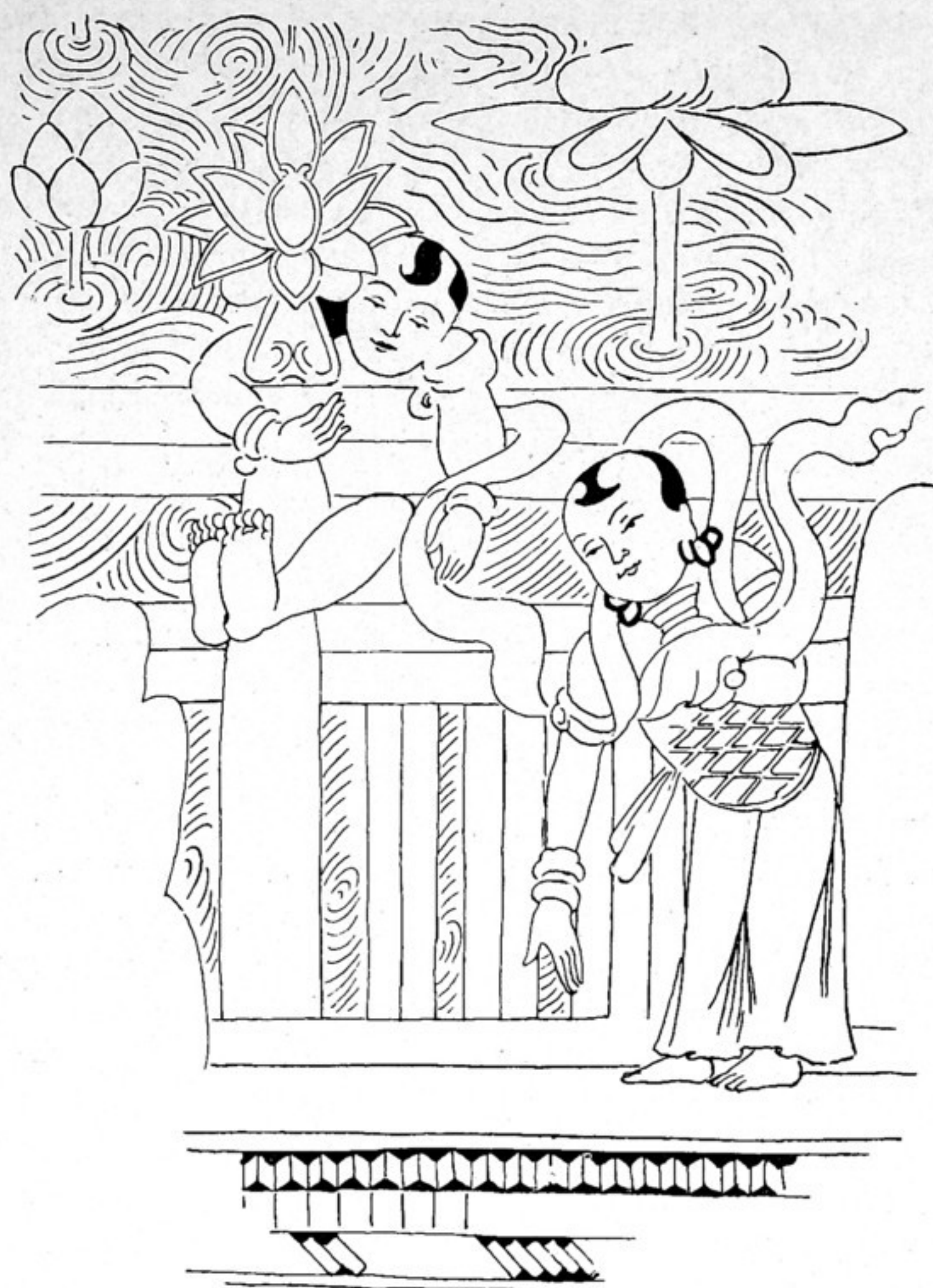
Fig. 505. Unt. Ecke des Sukhāvati-Bildes auf d. Rückw. L v. Amitābha Orig. 24 cm. hoch.