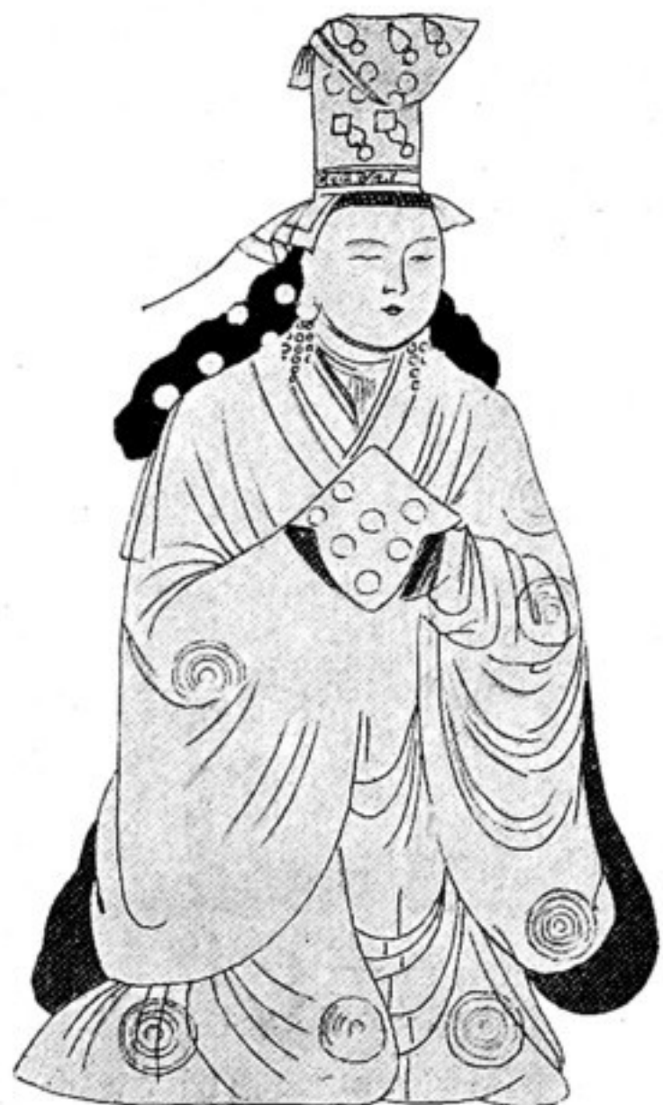
Fig. 506. Figur einer Stifterfrau, unt. d. R. Seite des Amitābha auf Rückw. Höhe des Orig. 66 cm.