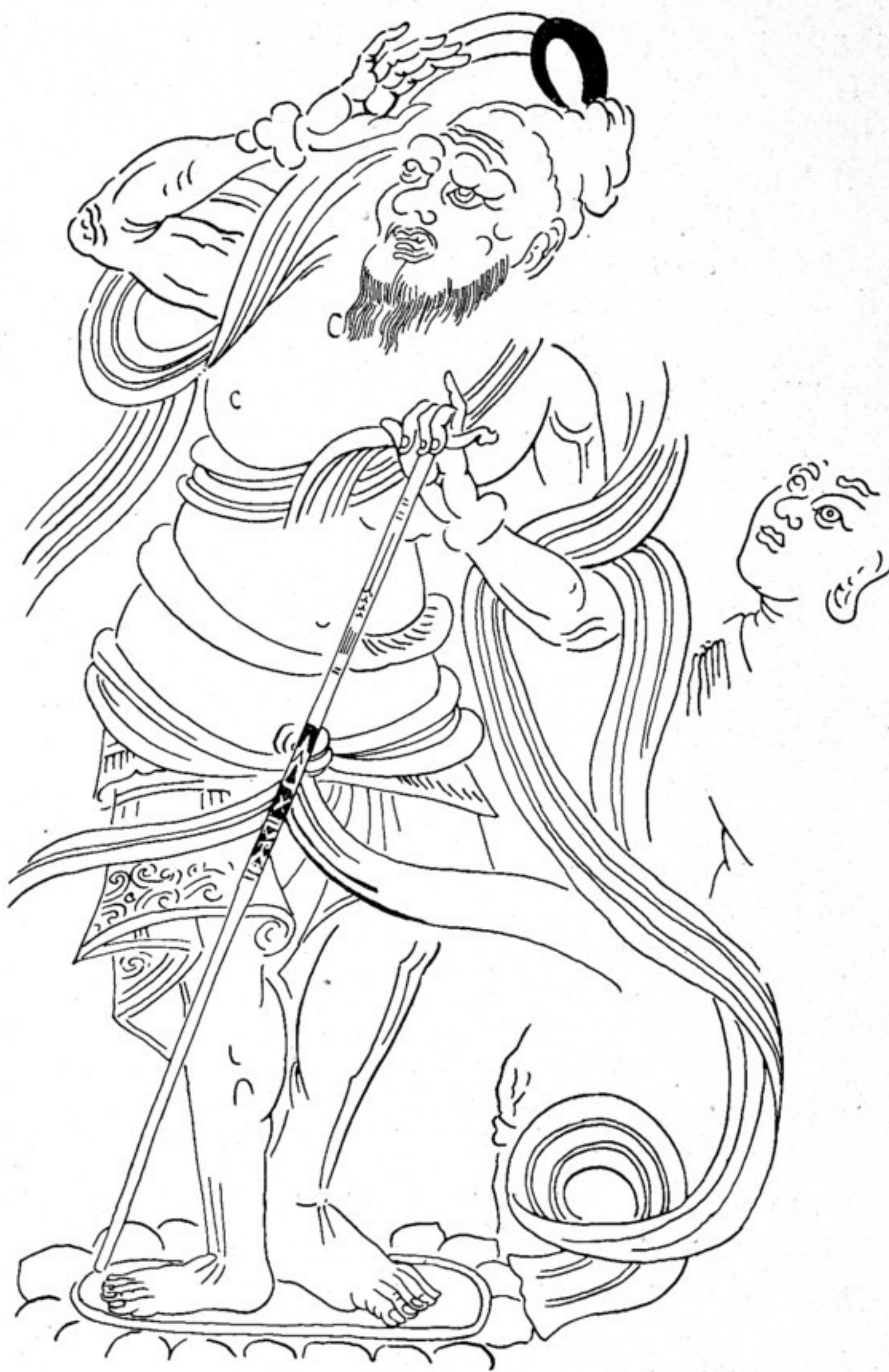
Fig. 507. Brāhmaṇa unt. d. L Seite des Avalokiteśvara Seitenw. B. Höhe des Orig. 84 cm.