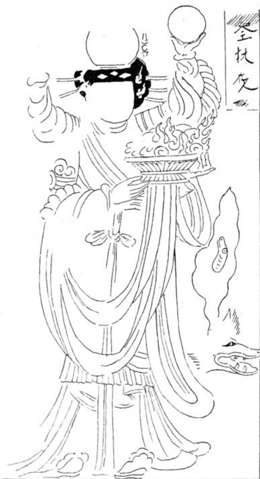
Fig. 531. Devatā auf der Türlaubung.