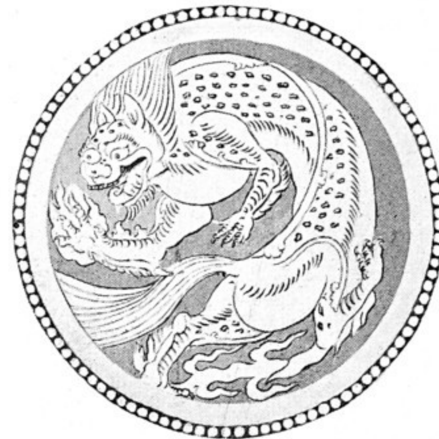
Fig. 539. Muster aus d. Gewande d. Stifterfig. auf e, Fond himmelblau, Tiger mattgelb, Rand rot mit weiß. Perlen. Conturen rotbraun. Orig. 16 cm Durchm. — Höhle 10.