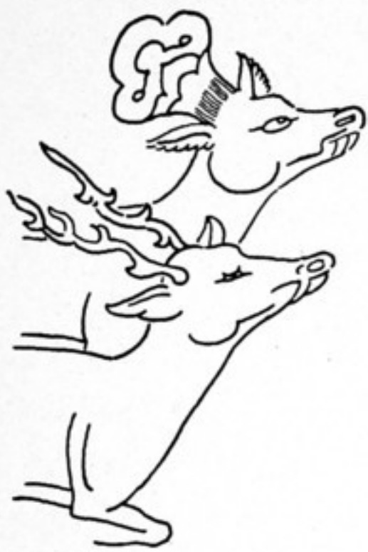
Fig. 533 a.