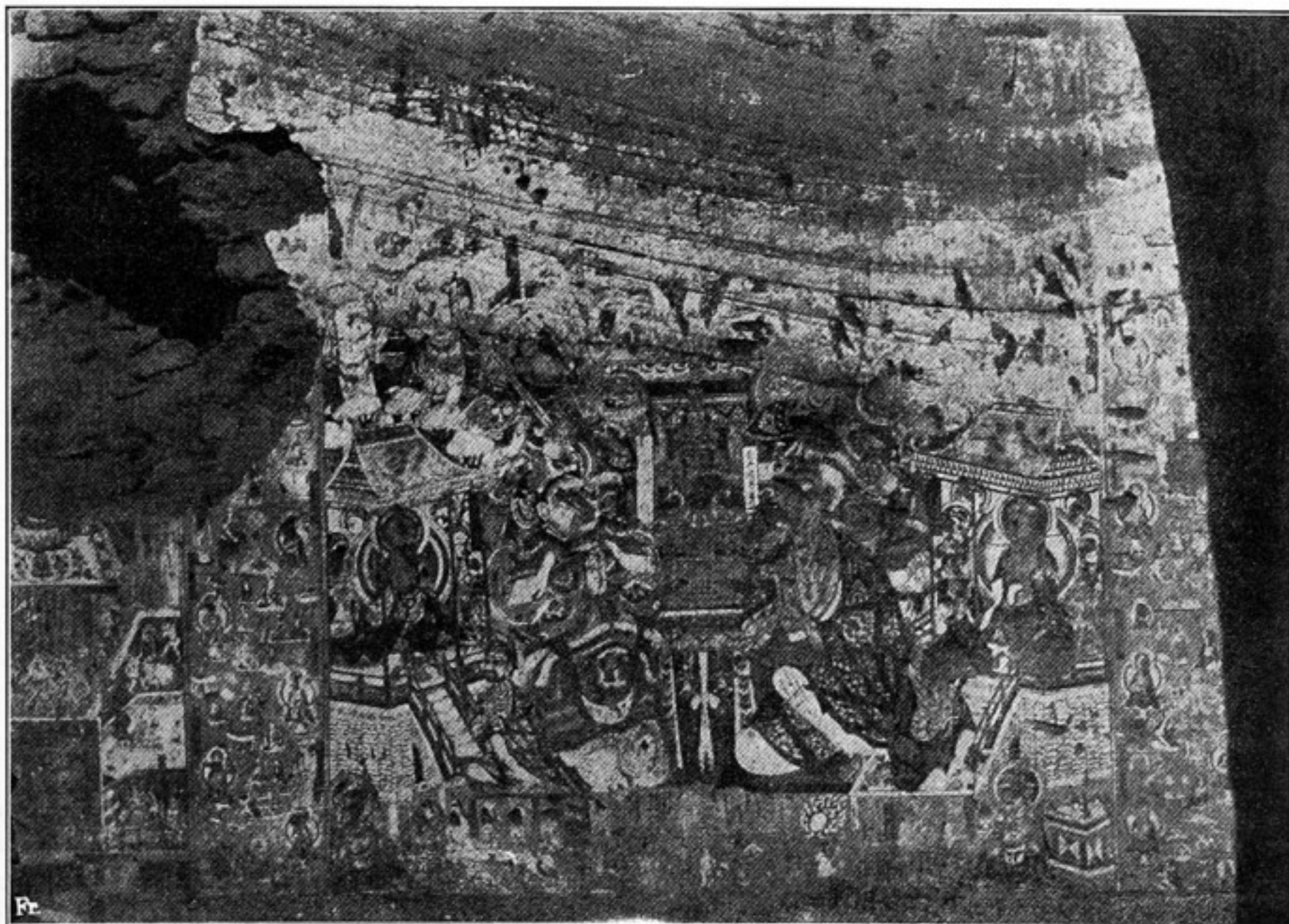
Fig. 535. H. 8.

Grünwedel, Altbuddhist. Kultstätten in Chines. Turkistan.