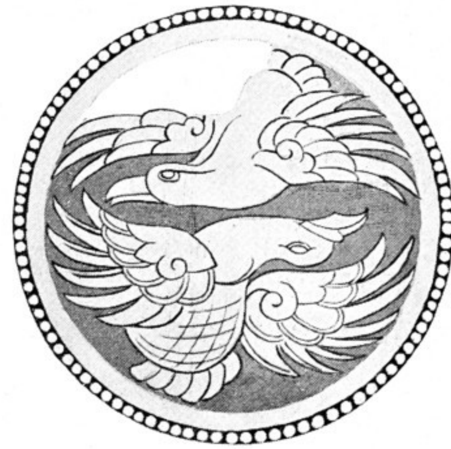
Fig. 538. Muster aus d. Gewande d. Stifterfig. C. Fond himmelblau, Vögel mattgelb, Rand rot m. weiß. Perlen. Conturen rotbraun. Orig. 16 cm. Durchm. — Höhle 10.