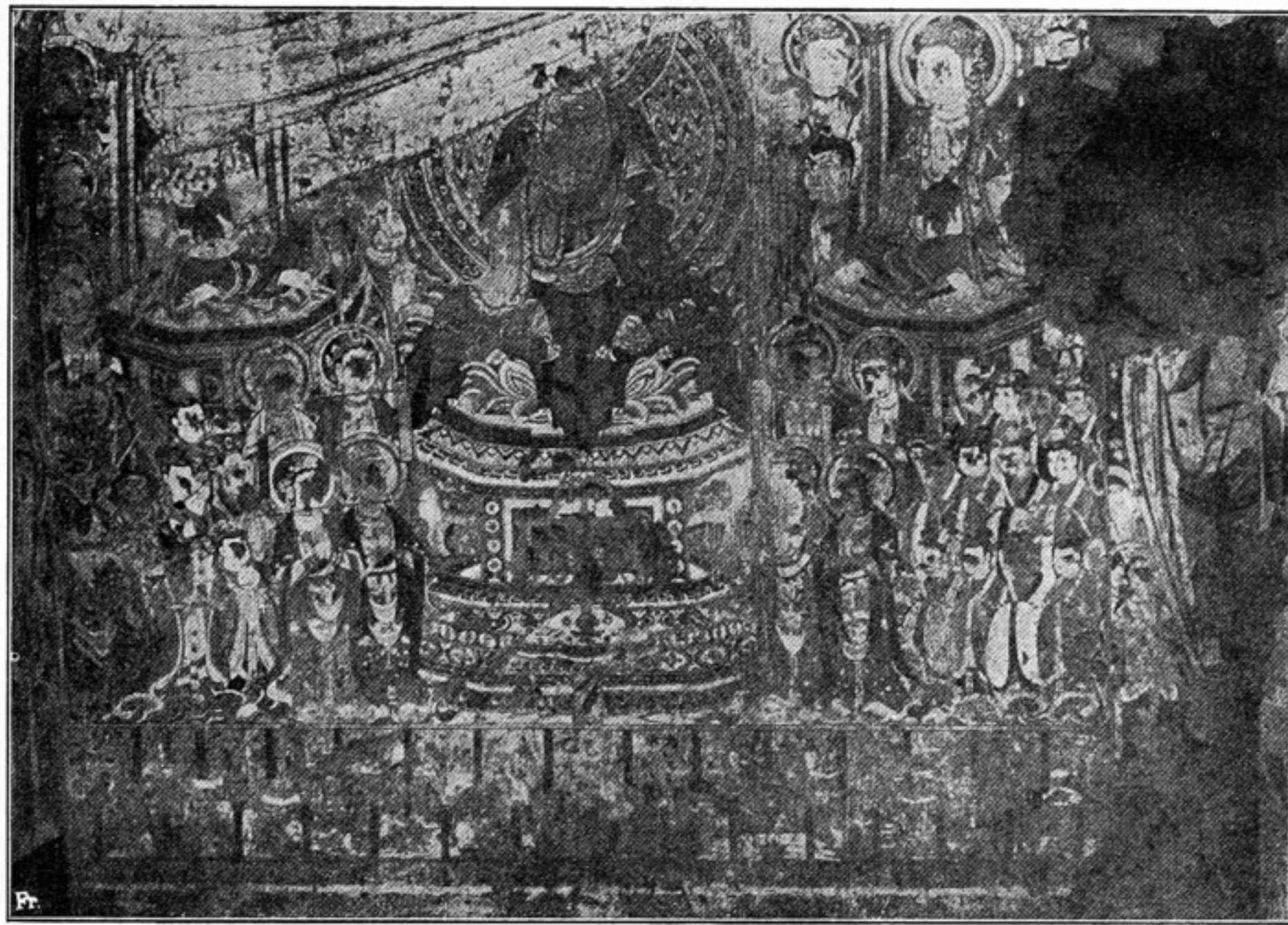
Fig. 534. H. 8.