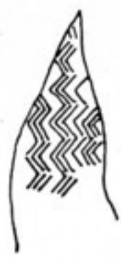
Fig. 533 b.