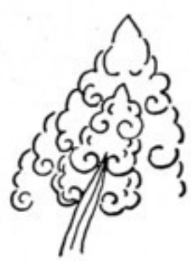
Fig. 533 c.