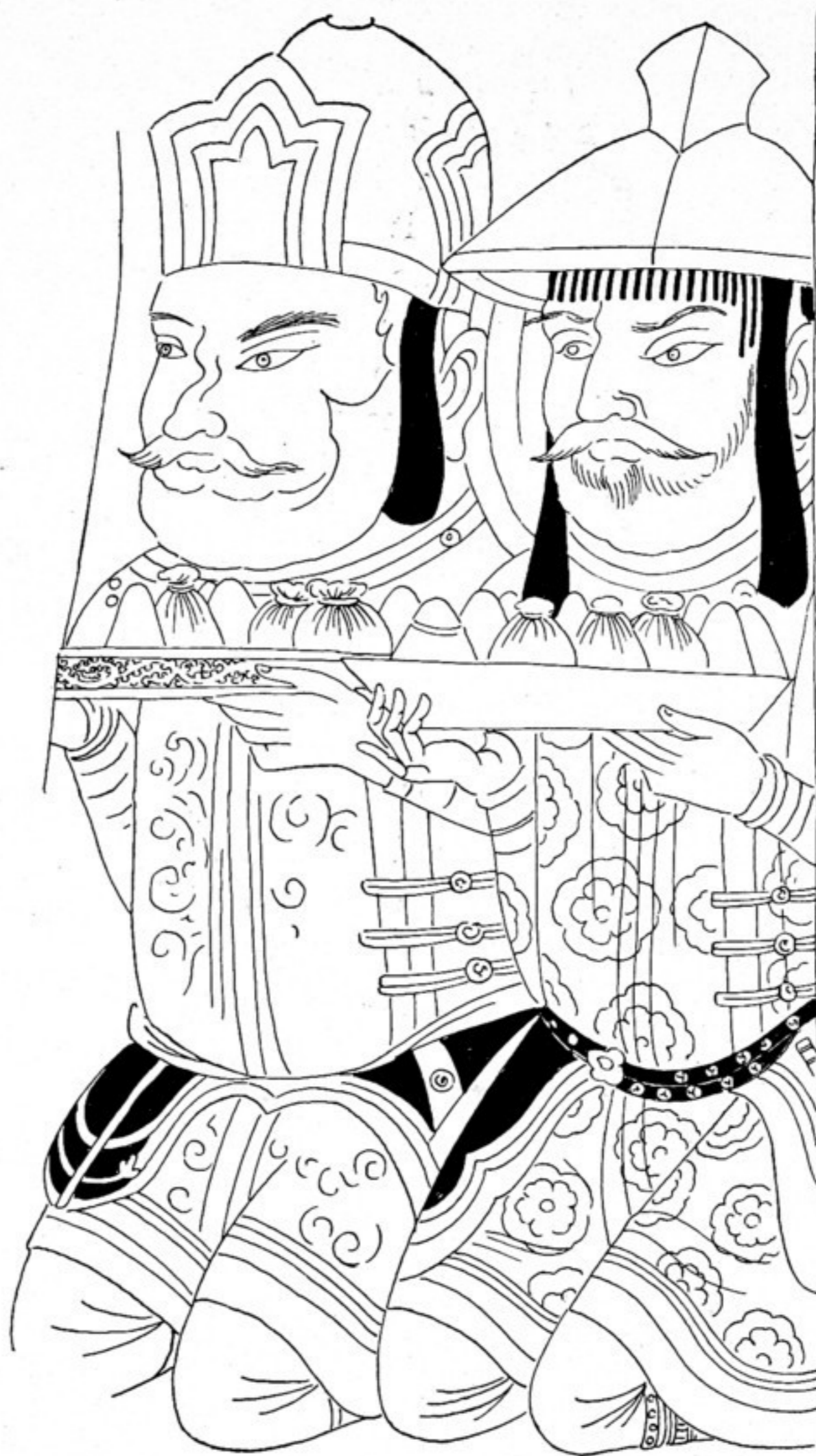
Fig. 567. Fig. aus a, 2 bei b. Orig. 42 cm hoch.