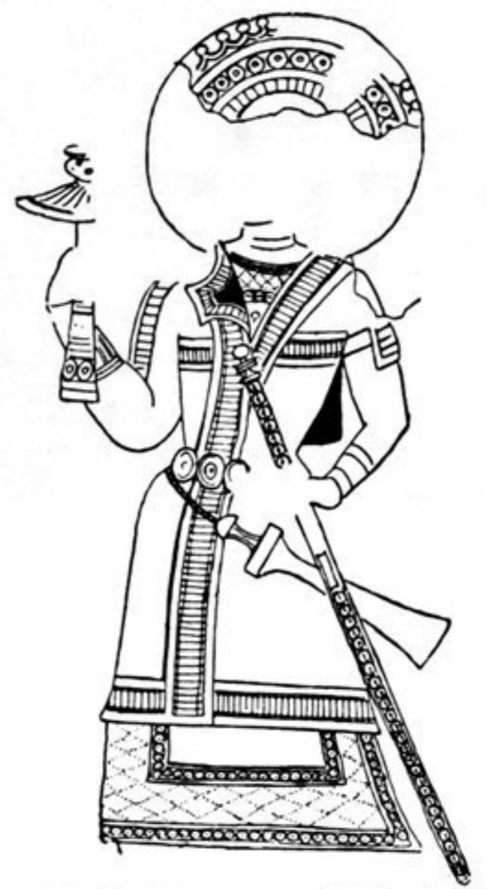
fig. 17. Höhle Nr. 15, 1. Schlucht, Qumtura, um 700 (?).

Noch nicht ausgepackt, Museum f. Völkerkunde .