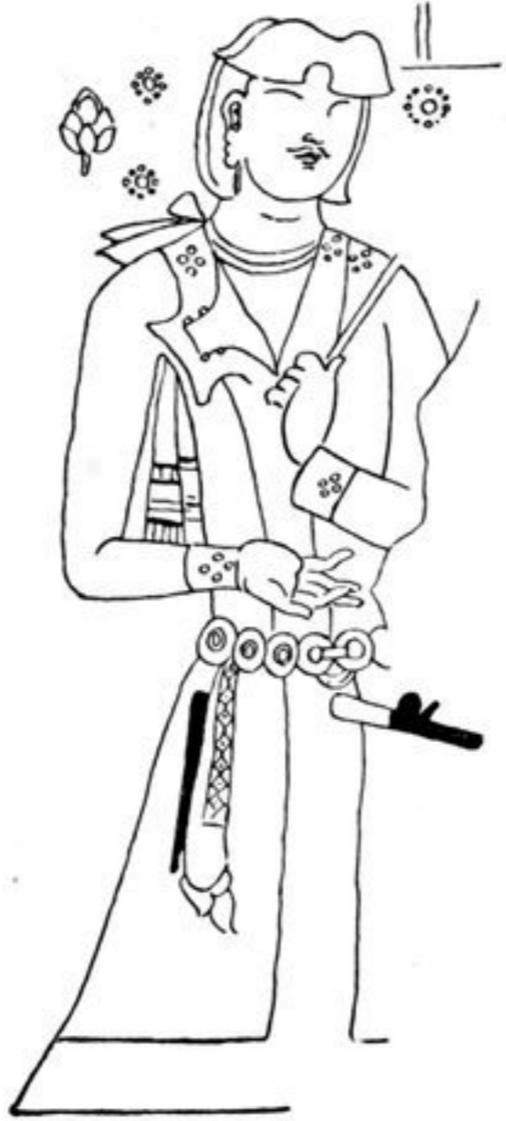
fig. 15. (G. 16) Höhle Nr. 15, 1. Schlucht, Qumtura. Stifter, ca. 700 n. Chr. (?).

Ärmelrock: hellrosenrot. Borten: dunkelhochrot m. weißen und blauen Punktmustern. Eigentümliche Kragenklappe. Scheibengürtel: gelb (golden). Hängendes Tuch am Gürtel ( fazzoletto ) weiß m. gelben Streifen. Nackentuch: Schleife hellblau, hängendes Ende weiß m. gelben Streifen. Eigentümliche Haartracht. Noch nicht ausgepackt, im Museum f. Völkerkunde .