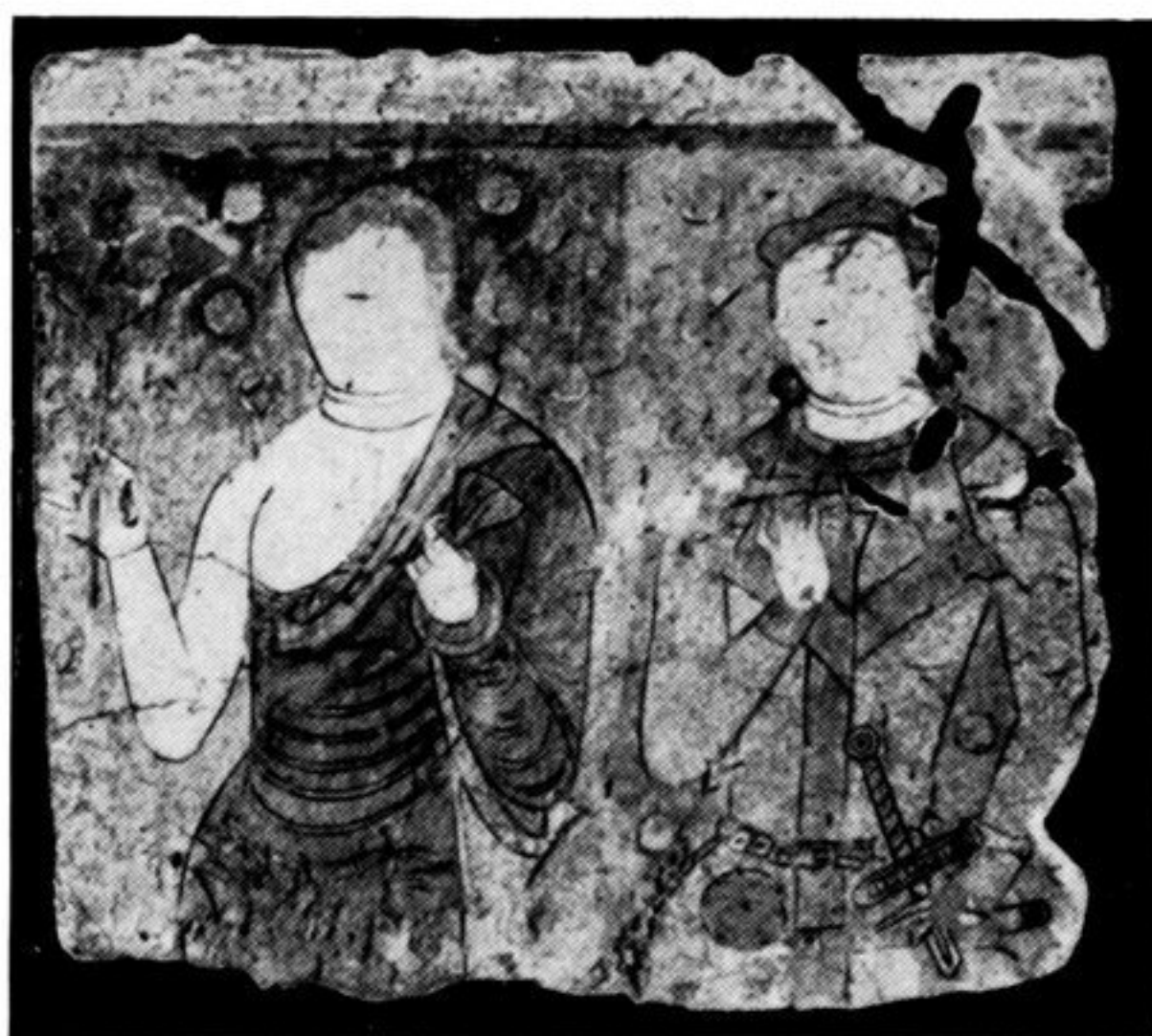
fig. 85. Tempel der „Kl. Bachschlucht 2“ Qyzil, vor 750 n. Chr.

Wandgemälde. Ritter. Rötlicher Ärmelrock m. breiter blauer Borte. Gurt u. Schwert weißlich-grau. Dolch: Scheide bläulich, Griff u. Beschläge weißlich-grau. R. am Gurt lichtgrüne rundliche Börse u. ganz R. weißliches fazzoletto mit schwarzem Ringornament. Perlenhalsband m. grünem Schloß. Unterkleid (am Halsausschnitt) rötlich m. blauem Oberrand.