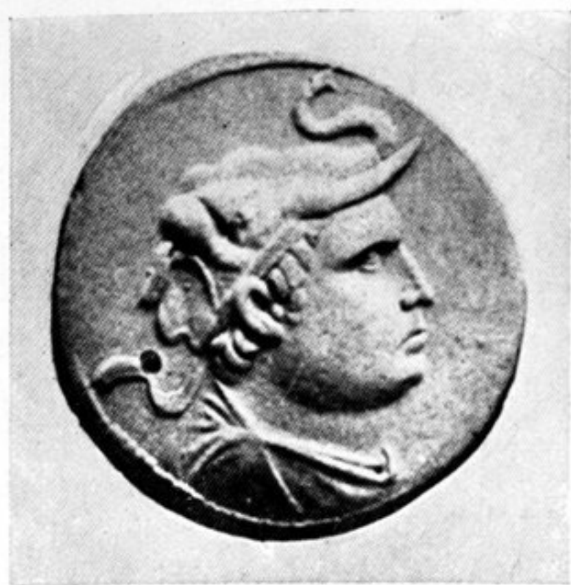
fig. 82. Münze mit dem Bildnis des graeco-baktrischen Königs Demetrius (200—160 v. Chr.) im Elefantenhelm, nach Rawlinson, Bactria , London 1912.