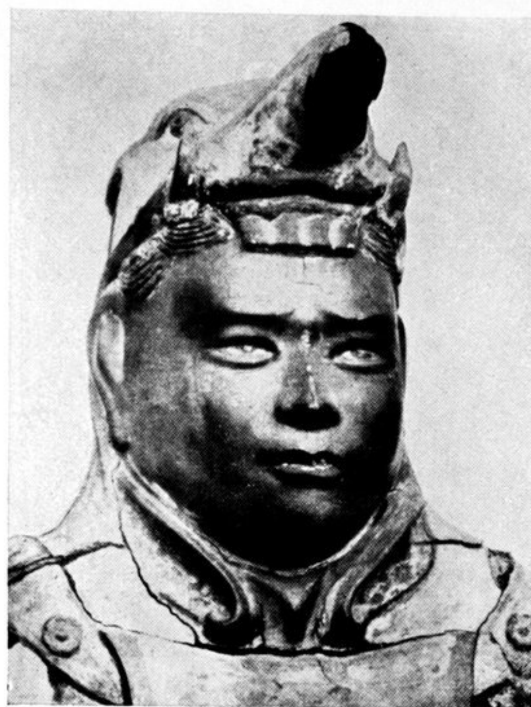
fig. 83. Holzstatuette eines Weltenhüters im Elefantenhelm, Japan.

Nach Curt Glaser, Ostasiat. Plastik , Cassierer 1925.