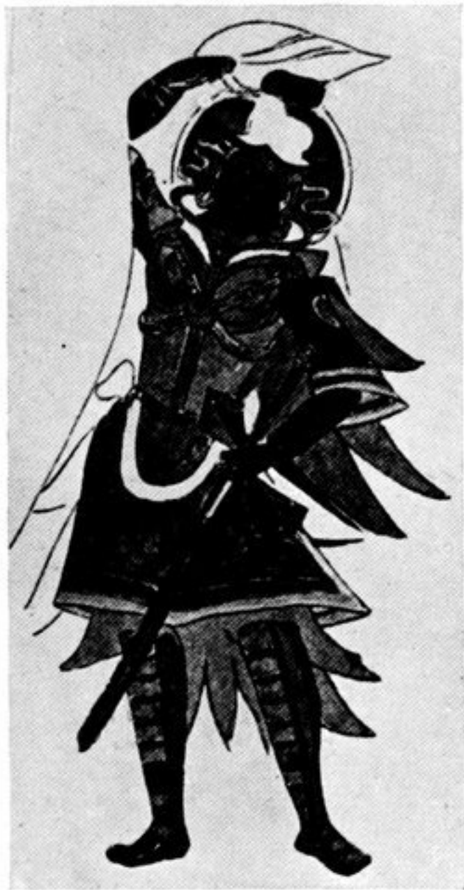
fig. 119. (G. 89) Vajrapāni mit Kesselhaube u. Federstutz. Kaminhöhle, Qyzil, vor 700 n. Chr.

Zweizipfliger Wimpel an gebogener Stange mit Tierkopf.