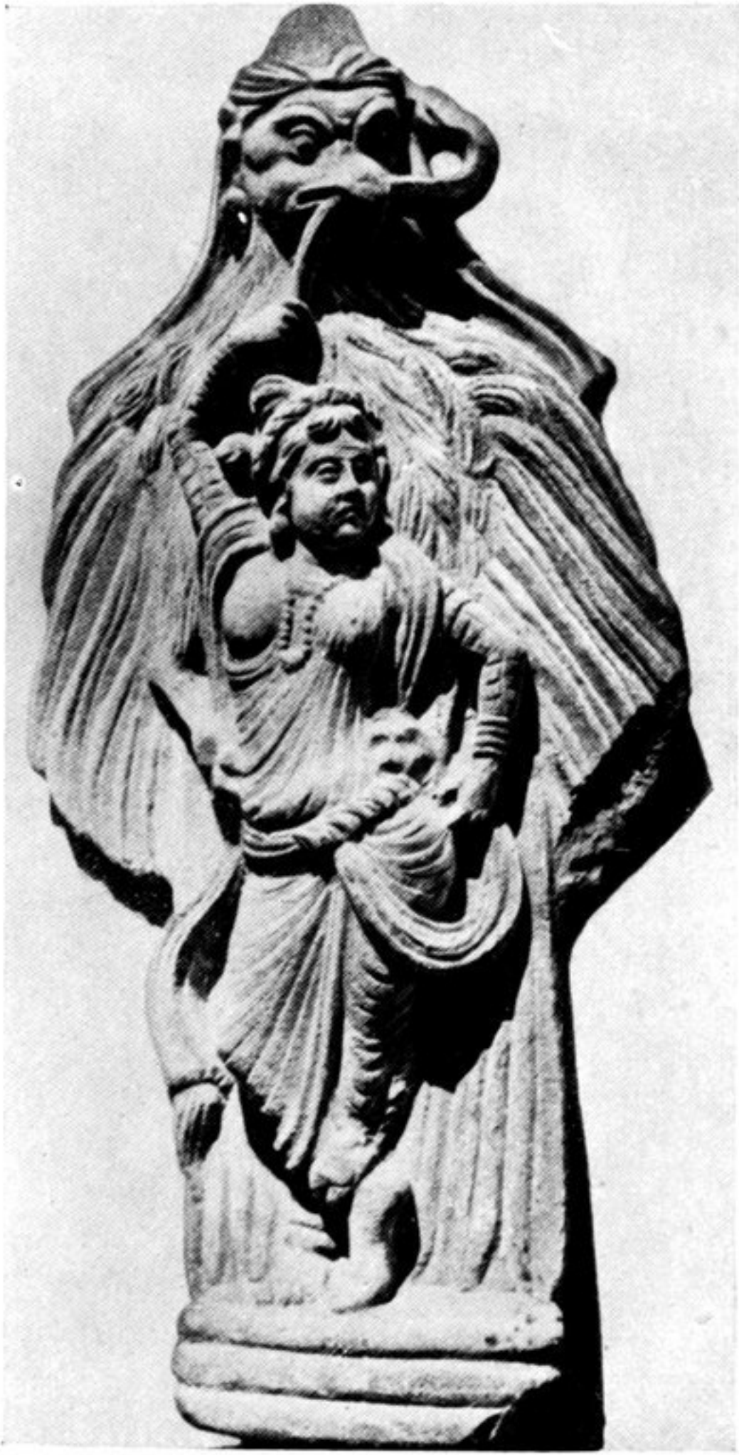
fig. 148. Greif (garuḍa) eine Schlangenfürstin ent- führend, adaptierte Ganymedes-Darstellung. Skulptur aus Gandhāra (Kabul-Gebiet, Af- ghanistan).