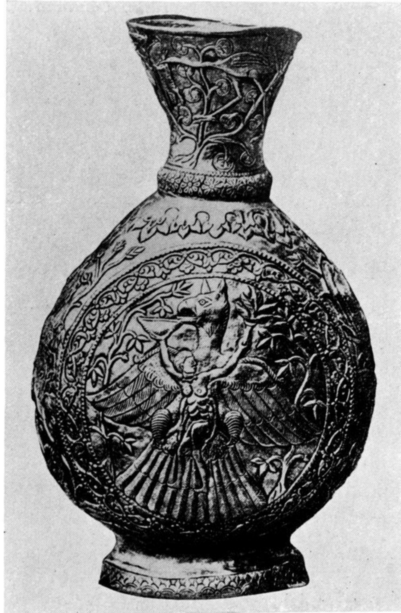
fig. 149. Sassanidische Goldvase. Wiener Museum. Entführung des Ganymedes.