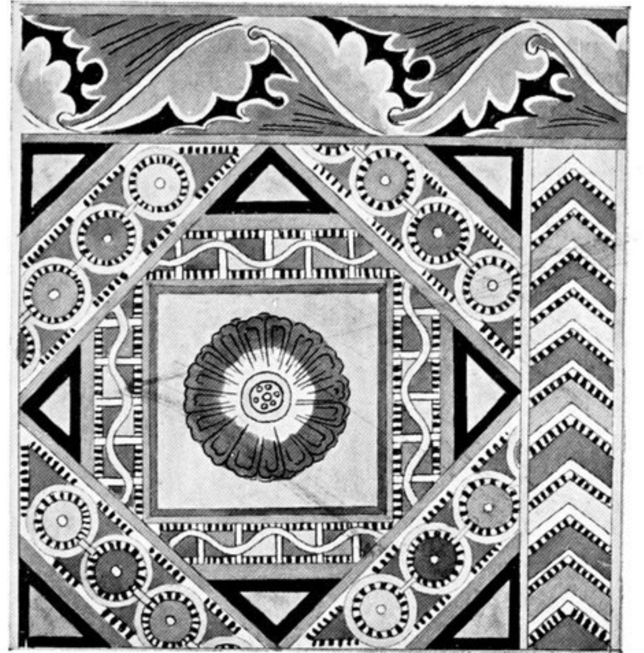
fig. 242. (G. 634) Gemalte „Laternen“-Decke. Ciqqan-Köl bei Murtuq, 8. Jhdt. (?)

Herdraum im Hause des Kadi im Dorf Namatgut, Pamirgebiet. Nach Olufsen, Through the unknown Pamirs , London.