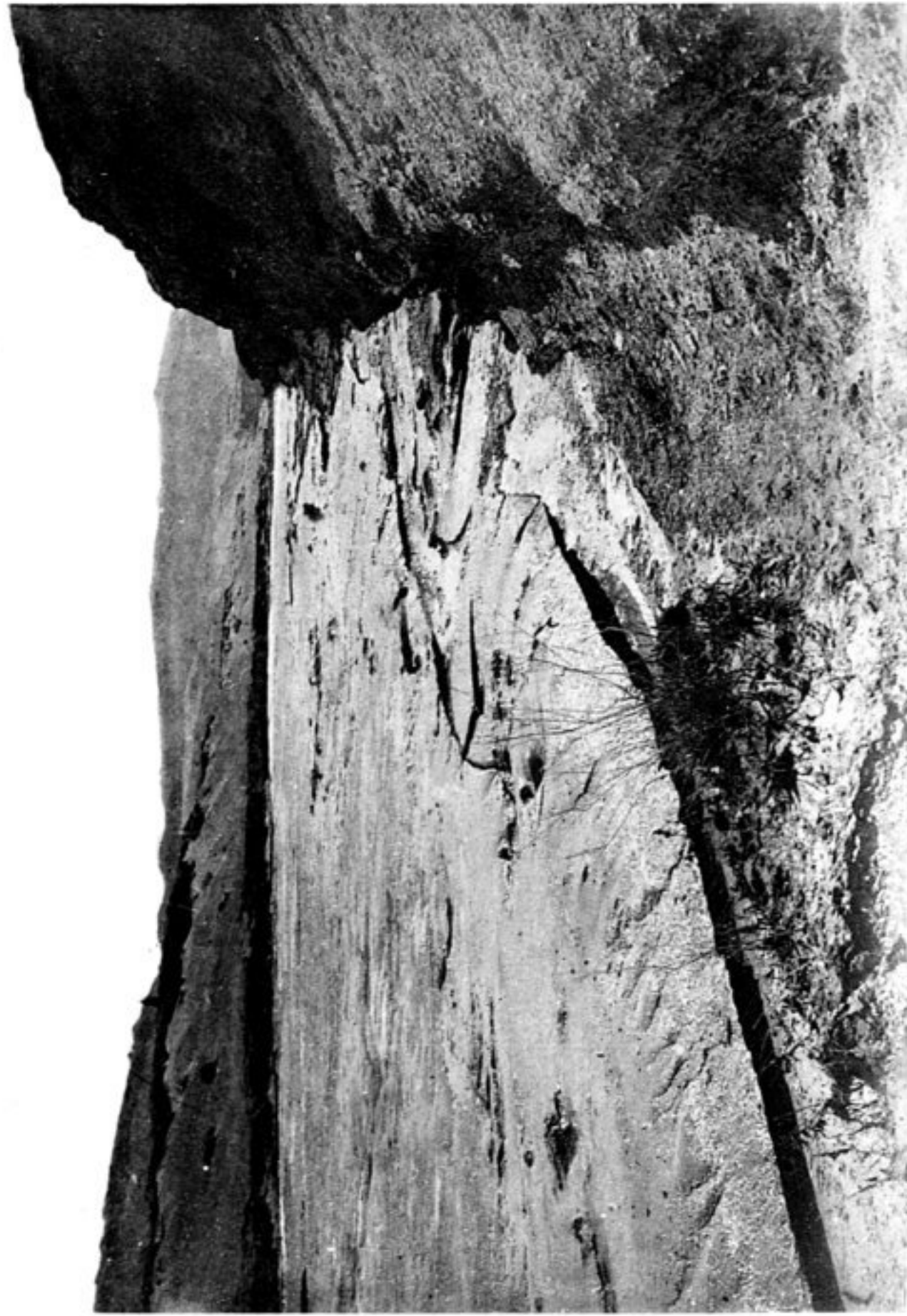
TOUEN-HOUANG — La rivière dégelée.