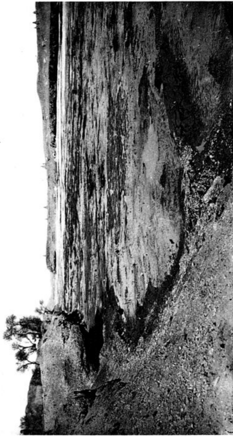
TOUEN-HOUANG — La rivière du Ts'ien-fo-tong gelée.