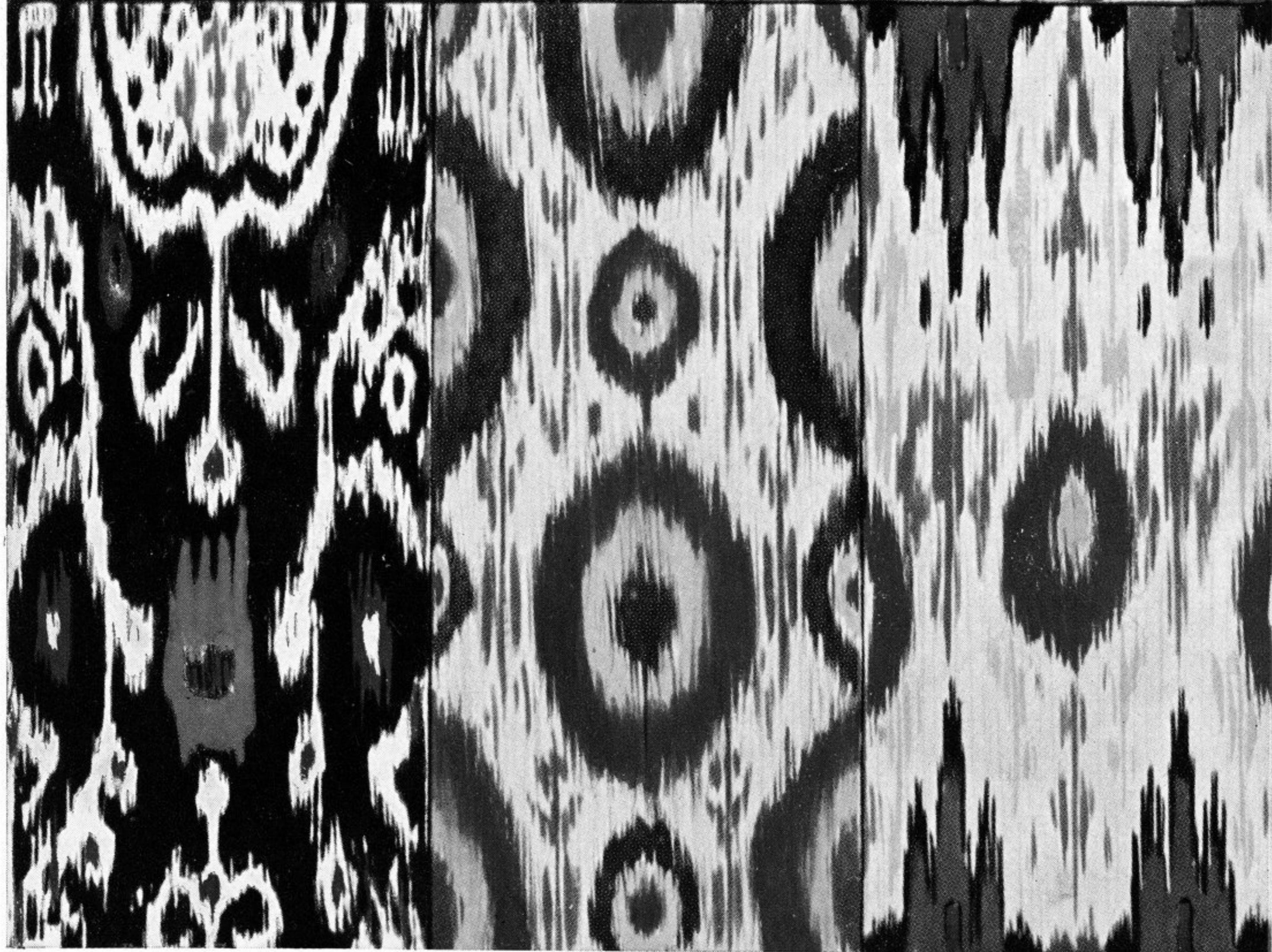
纏頭回婦人服の織樣式