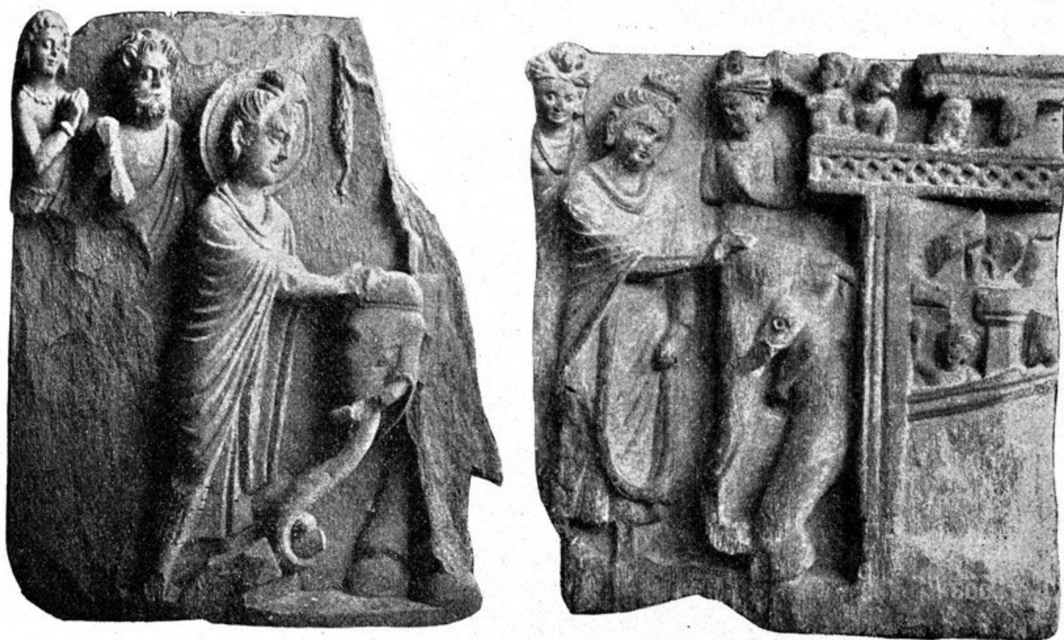
FIG. 267-268. — LA SOUMISSION DE L'ÉLÉPHANT.

pressent aux créneaux de la muraille; l'auteur de la figure 268 en a même installé sur un balcon vu de face et le résultat est une fabrique