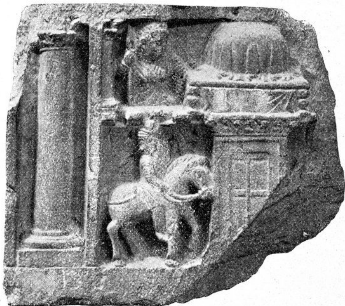
FIG. 289. — LA GARDE DES RELIQUES. Musée de Lahore, n° 198. Hauteur : 0 m. 20.

tion un peu risquée, nous signalerons le panneau de gauche de la figure 290 b , où reparaît le même décor; ici sa place, immédiatement à la suite de la crémation, prouve assez qu'il s'agit bien de